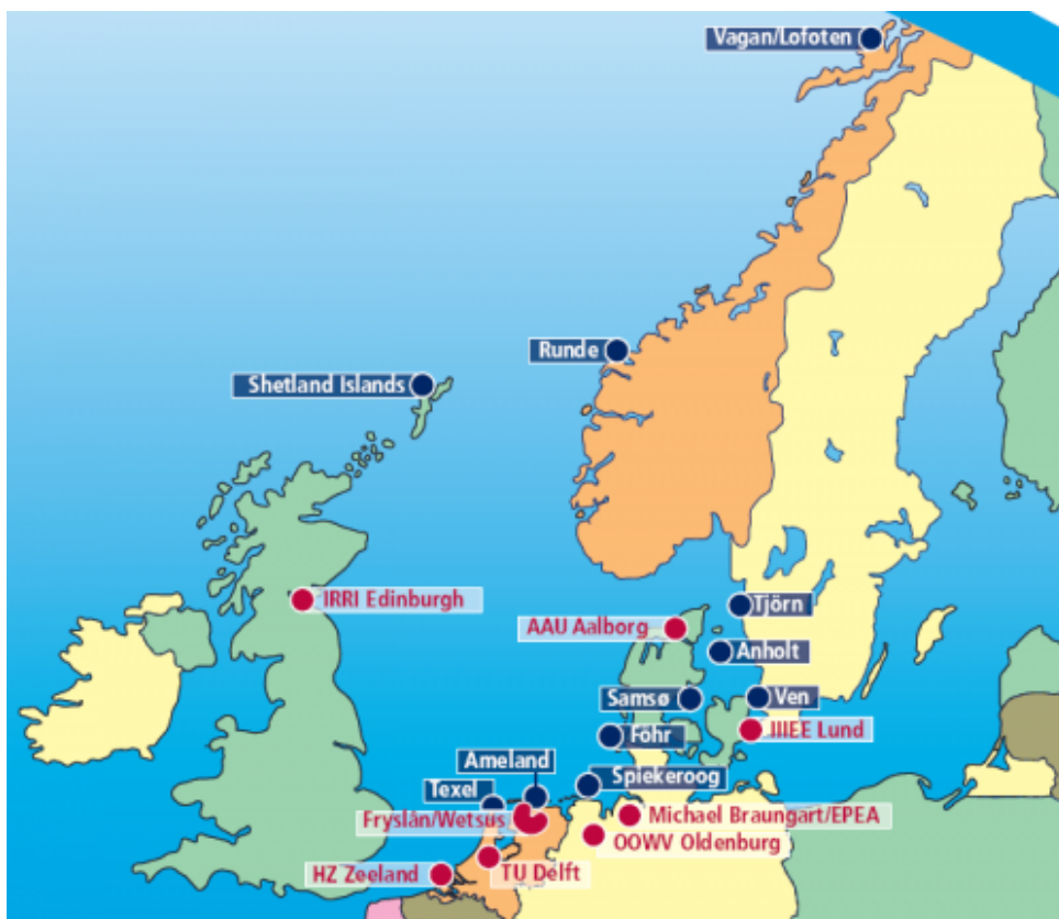
Kort 1 Partnere i C2CI-projektet