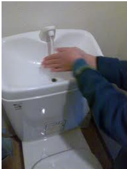
Billede 1 Cisterne med håndvask 5

I denne forbindelse kan der opnås viden fra Runde miljøcenter, da de arbejder med bæredygtige løsninger omkring opsamling af spildevand til produktion af biogas.