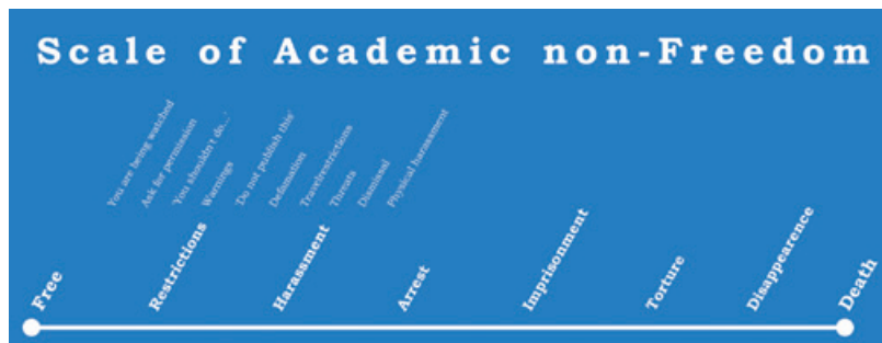
Figur 1. Begrebet "akademisk frihed" er et nøglebegreb for arbejdet i Scholars at Risk Network.

Når man så kigger på, hvilke discipliner der er i farezonen med hensyn til restriktioner-chikane-trusler-vold-fængsling-forsvinden-drab, tegner der sig et billede som i figur 3, hvor jura, politisk videnskab og ingeniørvidenskaber topper listen over risikable discipliner skarpt fulgt af medicin, sprogvidenskab og journalistik.