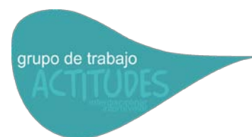
Imagen 1.- Grupo de trabajo internivelar e interdisciplinar “Actitudes”

Una vez expuesto el planteamiento, estructuración y organización general de la unidad didáctica del grupo de trabajo internivelar e interdisciplinar “Actitudes” y en el marco del “Estilo Actitudinal” (Pérez-Pueyo, 2005; 2010), pueden extraerse las siguientes conclusiones: