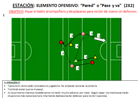
Imagen 2.- Ejemplo de ficha de trabajo (anexo I)

En este sentido, las situaciones de aprendizaje cooperativo que se provocan en la primera parte de las sesiones se basan en una asignación de tareas, organizada en 4 estaciones, siendo el profesor el encargado de controlar los tiempos de trabajo que serán de 6-7 minutos. Así, cada grupo comienza trabajando en una estación, en la cual encuentran una ficha donde se describe la tarea conjunta a realizar, y que presenta además un esquema y una simbología que deben interpretar inicialmente ( Imagen 2; ver Anexo 1 ). La premisa básica es que no se puede comenzar la práctica de la tarea asignada en cada estación, si antes no se han asegurado de que todos los componentes del grupo han leído e interpretado la ficha y han entendido perfectamente lo que hay que realizar. Para conseguirlo, los alumnos más hábiles y/o con más experiencia deberán resolver las dudas existentes, mientras que los alumnos con mayores capacidades de relación serán los encargados de mediar en dicho proceso y conseguir que todos los compañeros se impliquen activamente (evitando distracciones, por ejemplo) 18 . Para transferir la cooperación a nivel intergrupual, hacemos que en caso de no comprender la tarea planteada en alguna de las estaciones, un miembro del último grupo en pasar por la misma se encargue de la aclaración. Uno de los aspectos en los que más debemos insistir (para lo cual aprovecharemos las asambleas