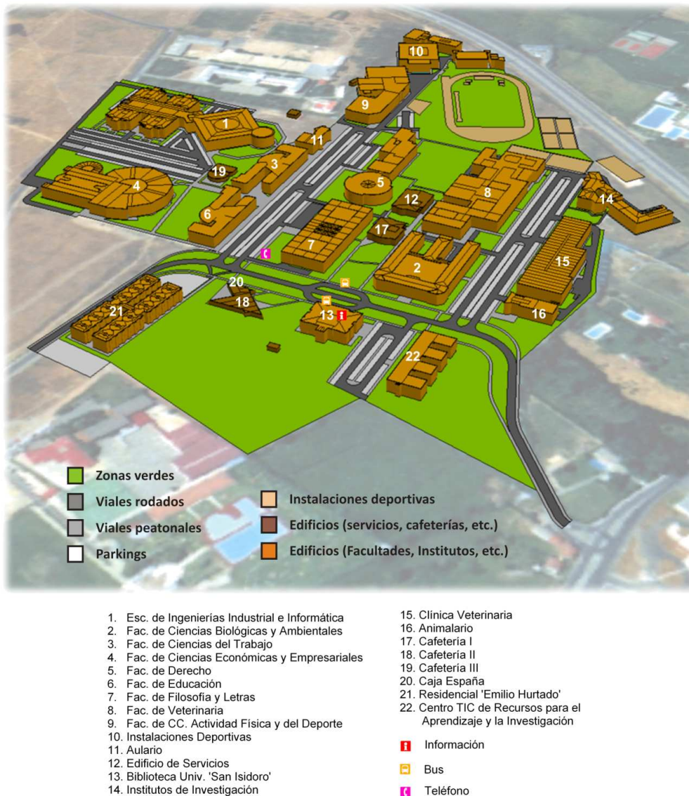
Ilustración 1: Vista en 3D del Campus de Vegazana en el año 2006, digitalizado con Arc GIS 9.2 (ESRI, 2006).