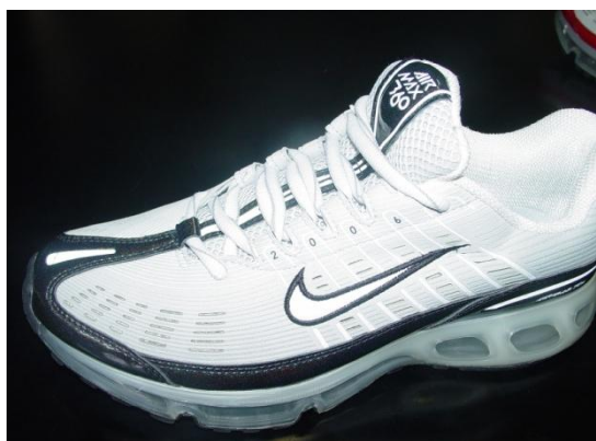
sporni znak na spornoj tenisici