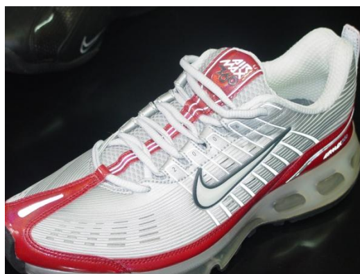
zaštićeni žig na originalnoj tenisici