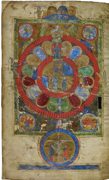
Fig. 4 – Berlin, Staatsbibliothek, Hamilton 390 (già Saibante), f. 2v.

na, di buona qualità – il non perfetto stato di conservazione non deve fuorviarci in questo giudizio – e soprattutto molto interessante per la concezione cui si ispira: è infatti costituita da due ruote di Fortuna, concentriche; quella più interna è la tradizionale ruota di Fortuna, con un personaggio che prima sale fino a diventare un monarca, poi perde la prosperità e infine precipita a terra. La ruota esterna è invece una ruota di ispirazione religiosa, che mostra la sorte morale dell'individuo: se è buono ascende, fino a giungere al Paradiso – un Paradiso qui caratterizzato dall'inconfondibile silhouette della basilica di San Marco a Venezia; se invece si comporta male scivola lungo la ruota fino a precipitare nell'Inferno, dove due orribili diavoli lo attendono accanto al fuoco eterno. Al centro delle due ruote c'è una scena di adorazione dell'Agnello mistico; segue, in basso, l'immagine della Crocefissione, mentre ai quattro lati della ruota più esterna dominano i simboli degli evangelisti – il cosiddetto Tetramorfo.