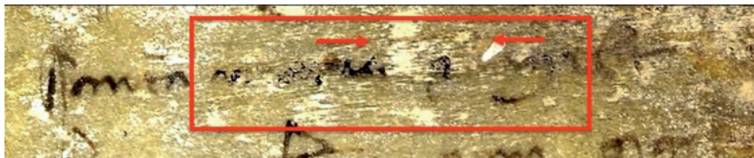
Fig. 6 – Berlin, Staatsbibliothek, Hamilton 390 (già Saibante), f. 1r (part. ulteriormente ingrandito).

di possesso è stata vergata è esplicita, e apparentemente chiara: 8 ottobre del 1350; la precisazione che però segue è decisamente meno chiara: a una prima analisi, era parso che una lettura «zo fo lo dì de madona santa Maria » si imponesse, ma qualsiasi calendario liturgico, passato o presente, conferma che in quel giorno nessuna chiesa cristiana dedica una festa alla Vergine. A guardare meglio l'immagine ad alta definizione della nota, si osserva però che il titulus sovrapposto alla i che segue la sequenza grafica santa maria si allunga verso sinistra fin sopra la a finale della sequenza stessa (Fig. 6); questo significa che, nelle intenzioni dello scrivente, deve intendersi che una consonante nasale andrebbe integrata non solo dopo la i di i(n) , ma anche tra la i e l'ultima a di Maria : insomma, la sequenza in questione potrebbe benissimo essere letta come santa Marina in mile ecc.