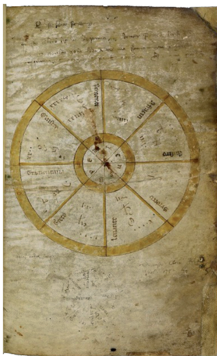
Fig. 3 – Berlin, Staatsbibliothek, Hamilton 390 (già Saibante), f. 1r.

astronomico, che a qualcuno è sembrata indizio di una provenienza da ambienti di mercanti usi a traffici transmarini e dunque, di fatto, veneziani. A smorzare gli entusiasmi interpretativi, si potrebbe subito precisare che la rosa dei venti è copiata male – qui Maestro (il vento di Nord-Ovest) è collocato a sinistra e non, come sarebbe corretto, a destra di Tramontana –, cosa che doveva renderla del tutto inutilizzabile a fini pratici.