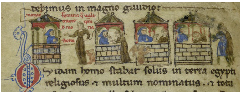
Fig. 1 – Berlin, Staatsbibliothek, Hamilton 390 (già Saibante), f. 34 v (part. con diavoletti dilavati).

c.), da considerare un monumento straordinario della nostra letteratura: si tratta infatti del più antico manoscritto che raccolga testi italiani, tutti localizzati nell'Italia del Nord e tutti riguardanti una tematica di tipo moralistico-edificante; è noto attraverso una sigla (Saibante-Hamilton 390) che ne identifica due degli antichi possessori – la famiglia Saibante di Verona e l'inglese lord Alexander Hamilton – e che ora è conservato presso la Staatsbibliothek di Berlino. Il codice è copiato da una sola mano, ed è fittamente ed elegantemente illustrato, anche se purtroppo in alcuni punti la situazione si presenta un po' compromessa sia per il deterioramento della pergamena sia per l'intervento di un qualche antico possessore, che ha pesantemente ripassato molte illustrazioni, talora alterandone persino il significato, e ha pure eraso o dilavato tutte le immagini nelle quali veniva rappresentato il diavolo (Fig. 1).