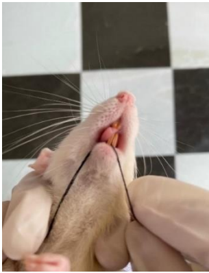
Gambar 2. Induksi periodontitis ligasi dengan silk ligature