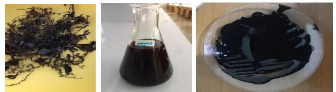
Gambar 1. Gel Ekstrak Sargassum sp Konsentrasi 75%

dua lapisan. Lapisan etil asetat kemudian diuapkan sehingga diperoleh fraksi murni flavonoid dari ganggang coklat ( Sargassum sp ). Setelah diperoleh fraksi murni flavonoid dari ganggang coklat ( Sargassum sp ) kemudian diencerkan sampai konsentrasi 75%, setelah itu dilakukan pembuatan sediaan gel. HMCM 7% dikembangkan di dalam aquades sebanyak \pm 30 ml selanjutnya didiamkan selama kurang lebih 24 jam. Selanjutnya ditambahkan metilparaben serta propilparaben selaku bahan pengawet yang sudah dilarutkan pada propilenglikol selaku humektan, tambahkan 1gram fraksi flavonoid ganggang coklat ( Sargassum sp ) yang sudah dicairkan hingga konsentrasi 75%, diaduk sampai homogen. Kemudian tambahkan sedikit demi sedikit aquades dan diaduk hingga homogen dan konsistensi seperti gel (gambar 1).