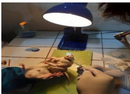
Gambar 4. Aplikasi gel ekstrak ganggang cokelat

Tahap pengukuran kadar Alkaline Phosphatase melalui pengambilan 0,2 ml ke dalam tabung reaksi lalu mengencerkannya hingga mencapai volume 10 ml. Sampel ditambahkan monoreagen yang merupakan gabungan dari p-Nitrophenyl phosphate , Diethanolamine dan Magnesium chloride . Mencampurkan sampel dan monoreagen ke dalam tabung menggunakan vortex. Pengambilan sampel yang sudah dicampur dan dimasukkan kedalam tabung ukur (kuvet). Analisis kadar Alkaline Phosphatase dengan pembacaan