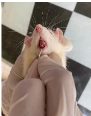
Gambar 3. Pengambilan Cairan sulkus gingiva dengan periopaper