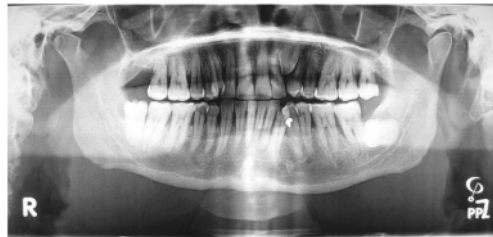
Gambar 1. Radiografik panoramik/film panoramik 10 .

Bahan yang digunakan film panoramik sebanyak 36 buah dan kertas mika. Alat yang digunakan adalah panoramik x-ray unit digital, viewer, jangka kaliper, penggaris, dan spidol marker.