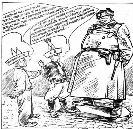
Päivän piirtoja 3165

Viime viikon lopulla leviteltiin Tampereella "jumalattomuusliikettä" ja nykyisiä hallitusta vastaan tähdättyjä "Tampereen Sinimustien" allekirjoittamia maanalaista lentolehtisiä, joiden johdosta sosialidemokraattinen Kansan Lehti kehoitti järjestysvaltaa panemaan fasisistimme lujille. — Nyt on kuitenkin fasisistimme pää-suunta selittänyt, että lehtiset ovatkin marxilaisten levittämiä, ja kehoittaa poliisia pitämään heitä tarkoin silmällä