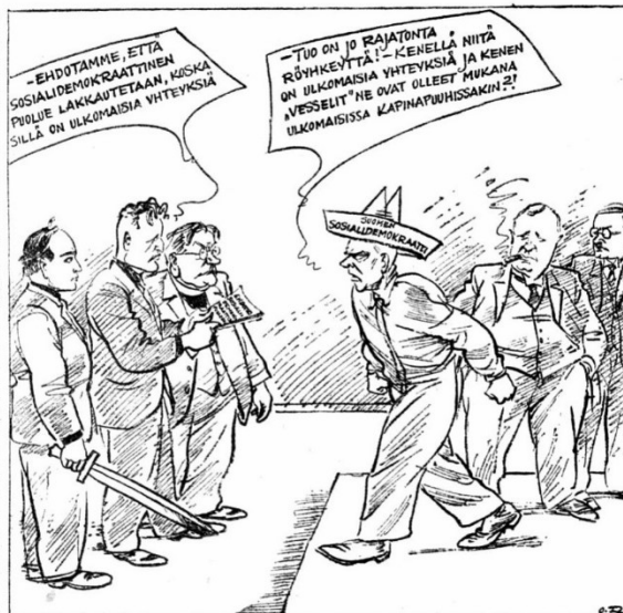
Päivän piirtoja 3195

S. Sosialidemokraatti tietää IKL:n jättäneen eduskunta-aloitteen, mikä tarkoittaa sosialidemokraattisen puolueen lakkauttamista m.m. sillä syyllä, että se on kuuliaisuus-suhteissa sosialistiseen kansainväliseen internationaaleen. Lehti pitää tuollaista "rajattomana röyhkeytenä" ja todistaa, että itse IKL on laitton ja ulkolaisista suhteista riippuvainen puolue.