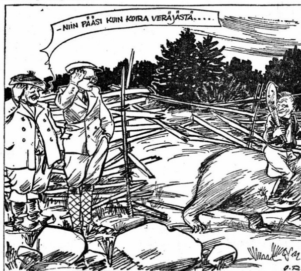
Päivän piirtoja 3395.

Eivät ne pitäneetkään IKL:n karhun tassuun loksautaneet ketunrauda, vaan uiskahtivat, ja elukka meni läpi sisäministerin rakenteleman risuaidan kuin koira veräjältä. Mahtaneeko sitten suunnitella sisäministeri oikeita karhunkouluja, piikkilankaestettä, koskapahan hallitus on antanut tiedonannon, missä ilmoittaa jatkavansa jahtia