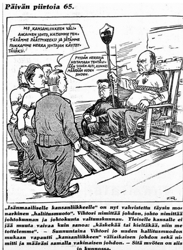
Kuva 6. Helsingin Sanomat 6.12.1932.