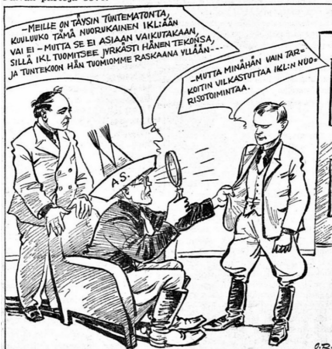
Päivän piirtoja 3376.