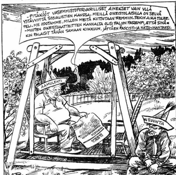
Päivän piirtoja 3288.

Hallituskärryiltä toistaiseksi tienoheen jäänyt oikeisto vaikuttaa joskus hiukan kiusaantuneelta nykyiseen asemaansa, mutta kiinnittää katseensa ensi vaaleihin, joissa toivoo kokoavansa niin runsaan äänisadon, että tulee sen no- lee noista asioista melko avomielisesti ja toivoo jo "mukulaakin" oikeiston jalla jo mahdollisesti kutsutuksi "remmiin". — Tamperelainen Aamulehti jutte- avuksi.