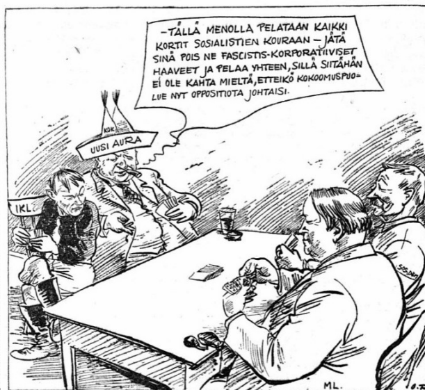
Päivän piirtoja 3358.

Vaalivuoden lähestyessä alkaa poliittinen "peluu" niiden varalta käydä yhä vikkelimmäksi. Oikeistolainen hallitusoppositio ei salaa sitä, että se alkaa pelata maalaisliittoon "pietin", ja sinä mielessä m.m. kokoomustlainen »Uusi Aura» houkuttelee jälleen "mukulaa" yhteispeliin. Sosialisteilla lehden mielestä on niin vankat valtit kourassa, ettei niille kukaan mitään mahda.