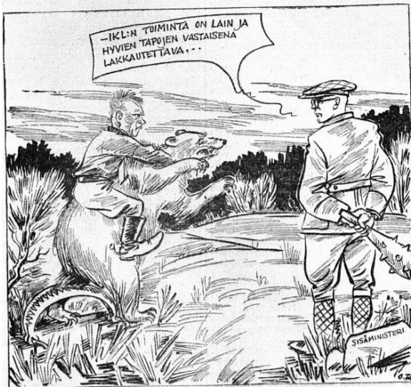
Päivän piirtoja 3387.

IKL:n suunnisto on paljon puhunut ”ketunrautojen loksauttamisesta” ja piikittellyt sisäministeriä, ettei hän uskalla käyttää ”Kekkonen konstejaan” liikettä vastaan. — Nyt on sisäministeri ”loksauttanut ketunrauda” ja ottanut pois piikkikurikan satimeen astuneen karhun selässä teutaroivalta ”synkkäkatsel- nelta fascistilta” kieltämällä hallinnollisella määräyksellä toistaiseksi liikkeen toiminnan lain ja hyvien tapojen vastaisena.