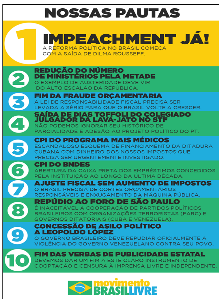
Figura 2 - Nossas pautas

O MBL, que originalmente convocou as manifestações de 15 de março e 12 de abril tem como pauta principal o Impeachment da presidente Dilma Rousseff. O Partido dos Trabalhadores utiliza a corrupção como instrumento para seu plano de poder. Mensalão e Petrolão foram mais do que apenas desvio de dinheiro, foram compra do legislativo pelo executivo destruindo assim a independência dos três poderes e os valores republicanos. Por isso o Impeachment de Dilma tem caráter mais emergencial e a pauta fundamental a ser levantada por todos os grupos ao redor do país e do mundo. Mas essa não é a única pauta do dia 12 de abril, seguem mais algumas reivindicações de todo o Movimento Brasil Livre, presente em mais de 100 cidades (MBL, 2015d).