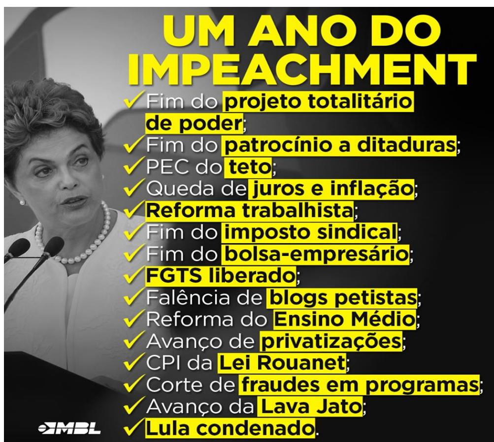
Figura 5- Um ano do impeachment

Um ano após o impeachment de Dilma Rousseff, o MBL agradece nas redes sociais pela participação da população nas manifestações. Além do fim do projeto “totalitário de poder do PT”, exalta o avanço na economia, pois apesar de poucas, boas reformas foram feitas: