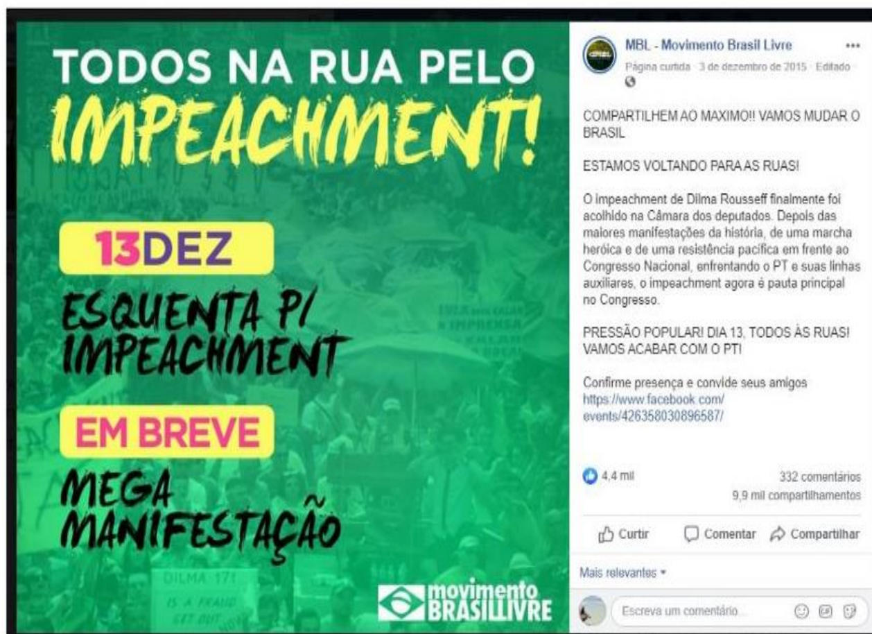
Figura 3- Esquenta para o impeachment