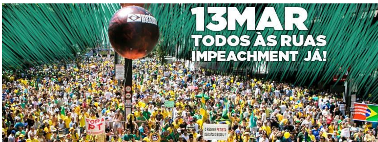
Figura 4- Todo às ruas, Impeachment já!