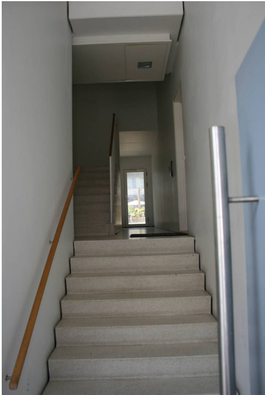
Figur 13. Havnestaden 2005.