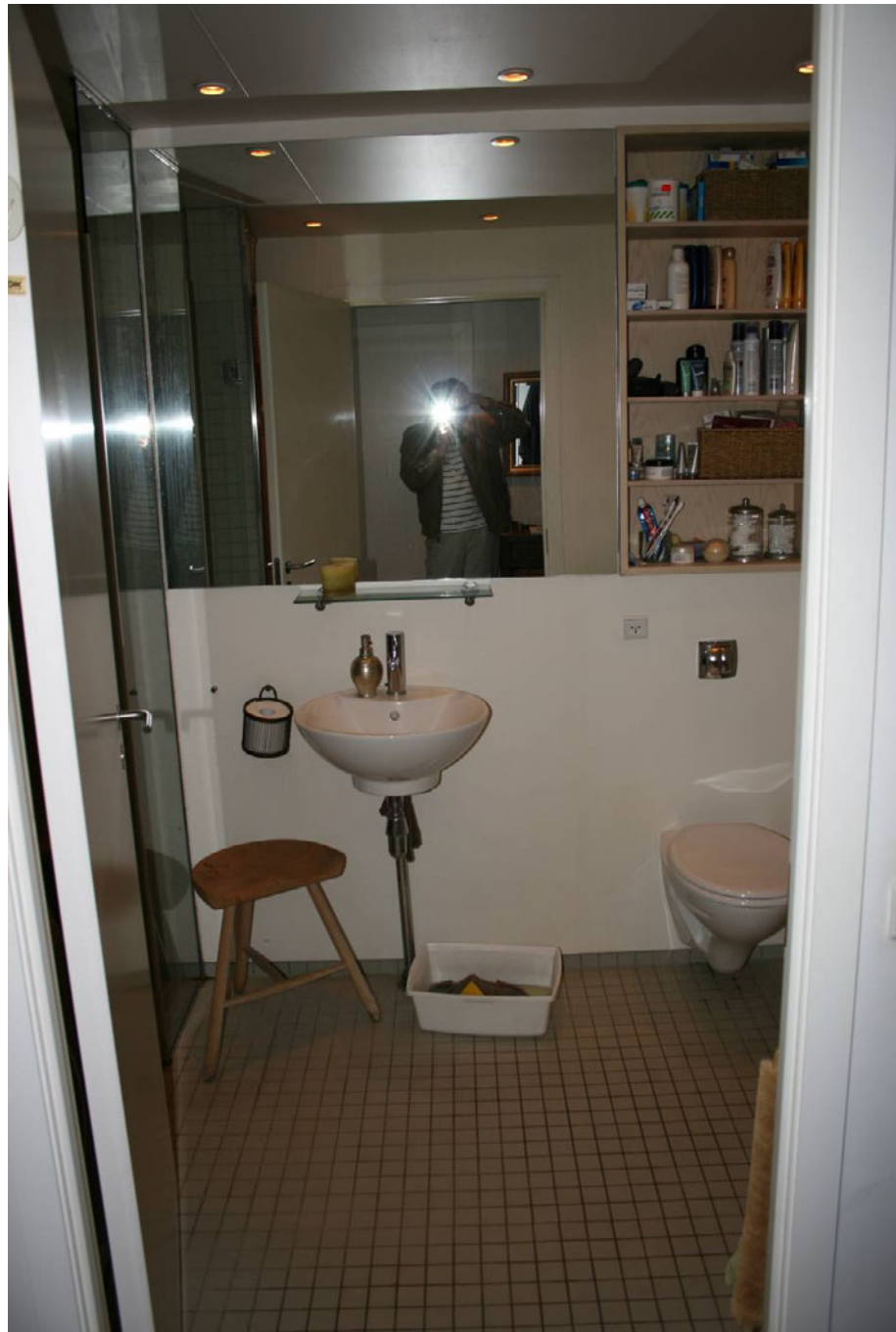
Figur 17. Havnestaden – 2005.