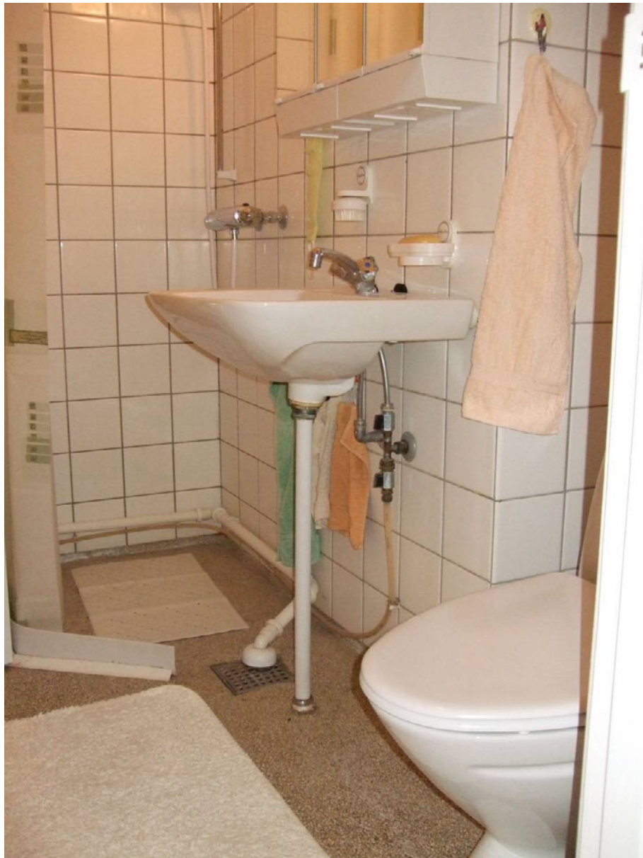
Figur 15. Sjælør Boulevard – 1970.