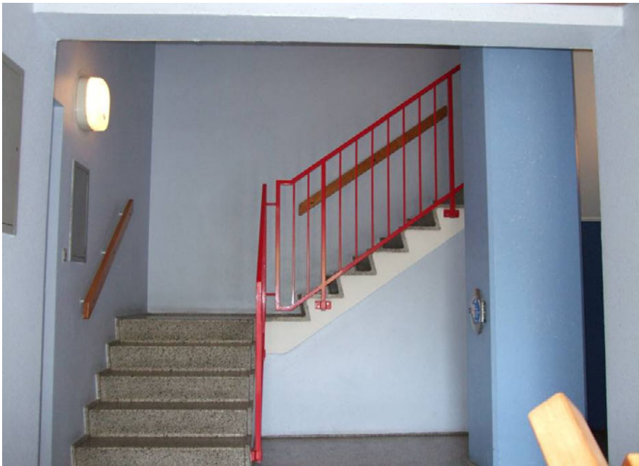
Figur 11. Sjælør Boulevard – 1970.