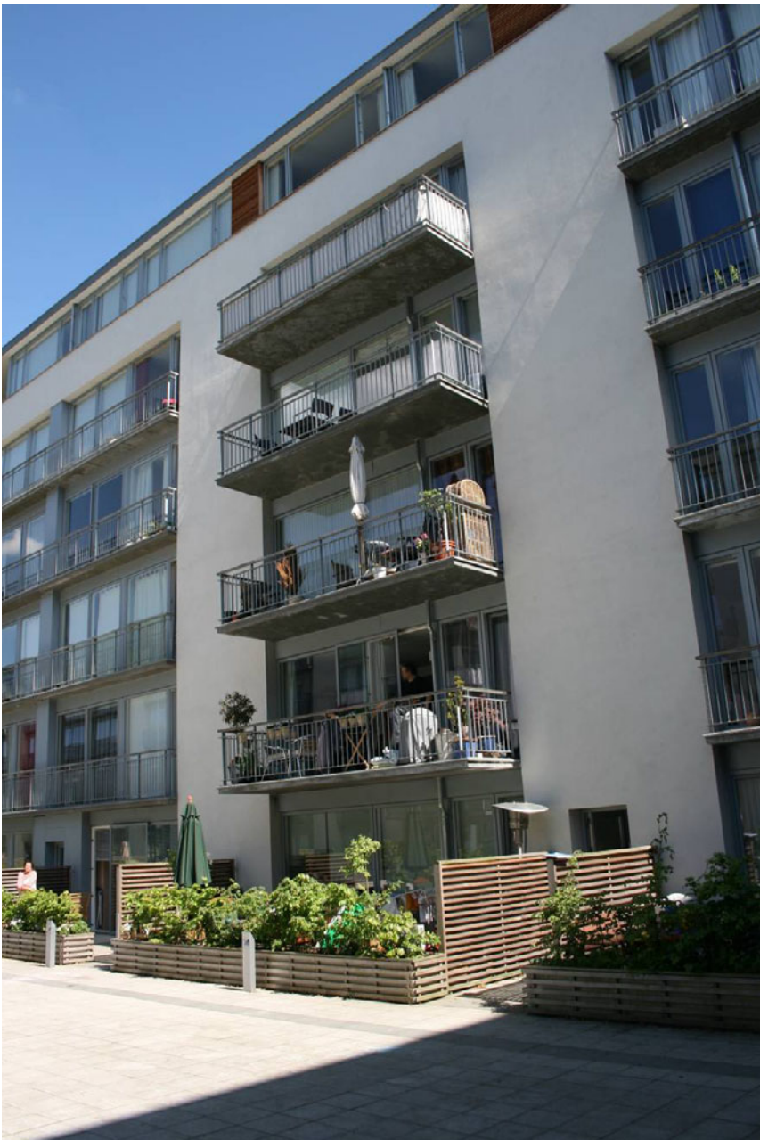
Figur 9. Havnestaden – 2005