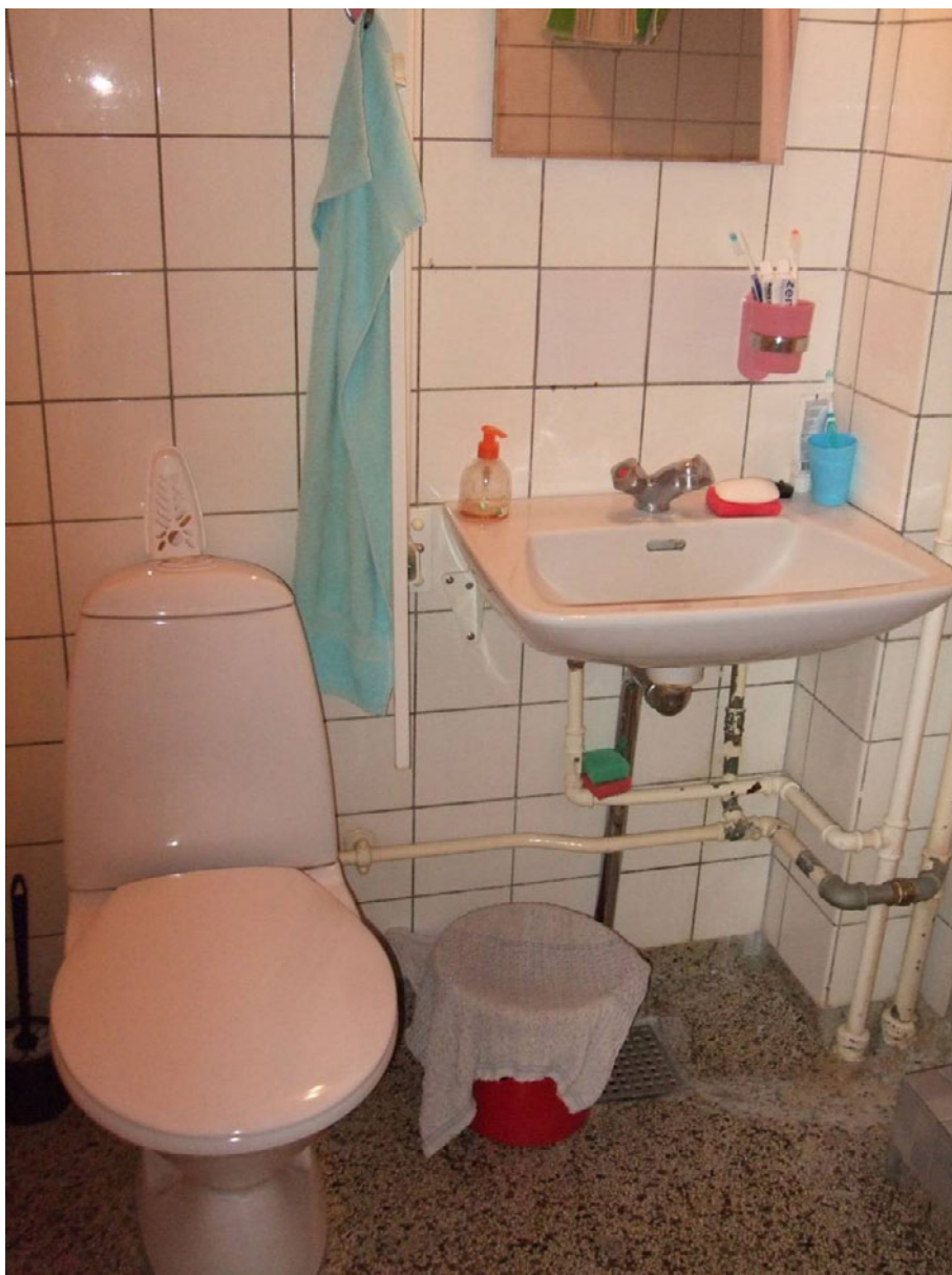
Figur 14. Herman Bangs Plads – 1957.