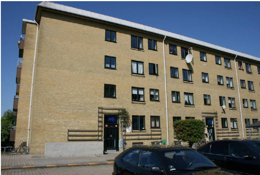
Figur 4. Sjøeløer Boulevard – 1970.