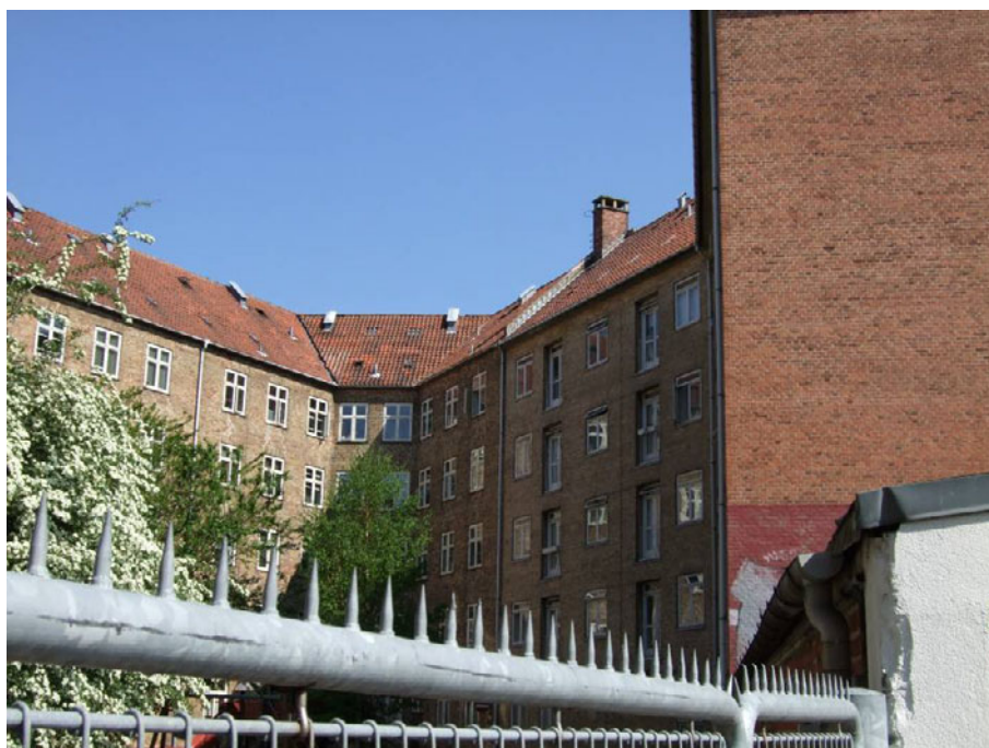
Figur 3. Herman Bangs Plads – 1957.