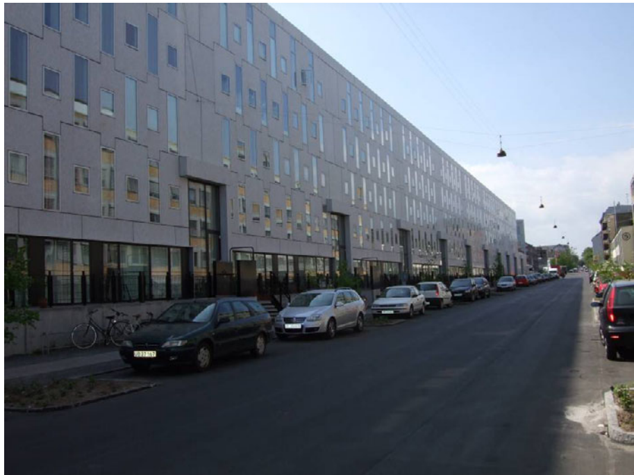
Figur 6. Emaljehaven – 2005.