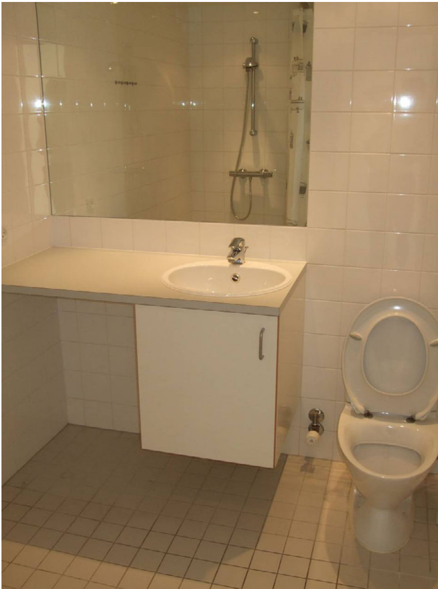
Figur 16. Emaljehaven – 2005.