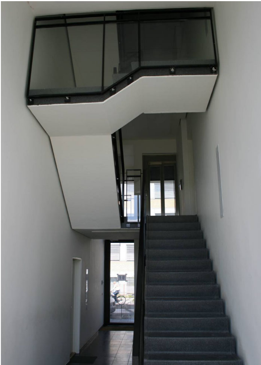
Figur 12. Emaljehaven – 2005.