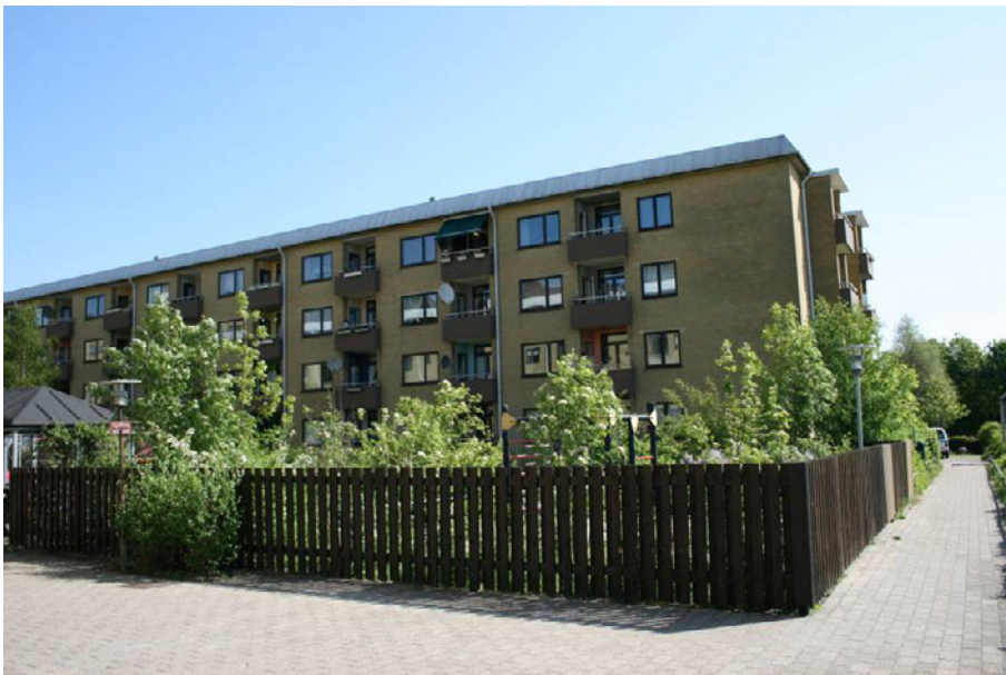
Figur 5. Sjøeløer Boulevard – 1970.