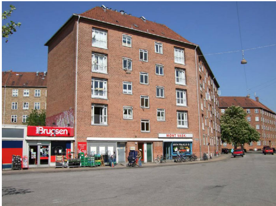
Figur 2. Herman Bangs Plads – 1957.