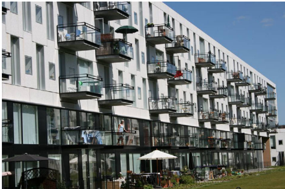
Figur 7. Emaljehaven – 2005.