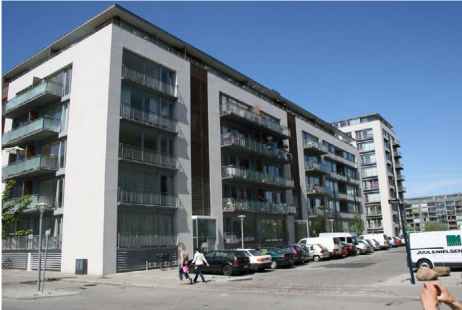
Figur 8. Havnestaden – 2005