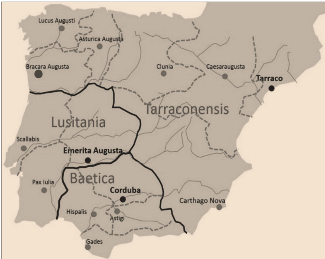
Figura 1 - Mapa com a localização de Bracara Augusta com a divisão administrativa da Hispânia

Tendo por base os níveis mais antigos detetados nas escavações na cidade, bem como a sucessão de eventos na vida de Augusto, apontamos a fundação de Bracara Augusta para os anos 16-14 a.C., data que encontra suporte tanto nas materialidades presentes nos primeiros enchimentos escavados, como na segunda deslocação do imperador a Tarraco , a capital da província (MARTINS et al. , 2017).