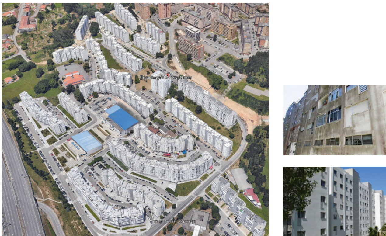
Figura 1 – Bairro social de Vila d'Este, em Vila Nova de Gaia. É um exemplo de reabilitação energética a nível de bairro. À esquerda, vista área; à direita, um dos seus edifícios residenciais antes e depois da intervenção.

As autoridades locais podem atuar como facilitadores, mediadores, coordenadores e motivadores. Através do planeamento energético local, da criação de normas e incentivos financeiros locais, especialmente incentivando a adoção de medidas de eficiência energética e o uso de energias renováveis, podem ajudar a promover modelos de negócio apropriados.