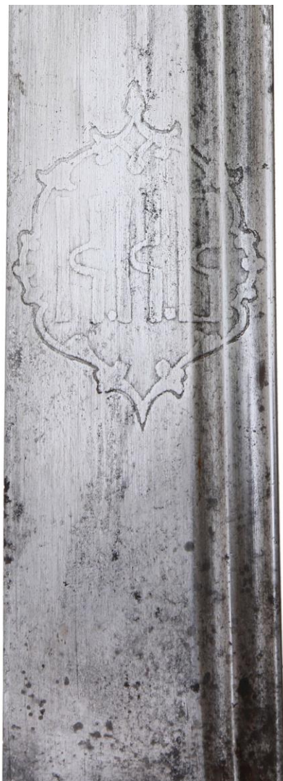
Илл. 15. Шашка без ножен, Кубанская область (клинок - Златоуст, 1890 г.), конец XIX в. Частная коллекция. Картуш с аббревиатурой войска.

известным фактическим материалом — на известных нам шашечных и кинжальных клинках златоустовского производства, изготовленных в 1888-1891 гг., присутствует картуш с аббревиатурой фабрики, в том числе на клинках 1890 года (Илл. 15 и 16).