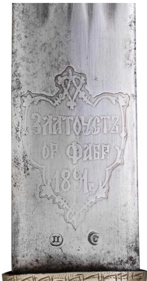
Илл. 17. Кинжал с ножами, Кубанская обл. (клинок - Златоуст, 1891 г.), конец XIX в. Частная коллекция. Картуш с сокращенным названием фабрики.

Судя по известным предметам, с 1891 года получает распространение практика изготовления клинков без картуша с аббревиатурой «К.К.В.», но с картушем, содержащим краткое название фабрики в разных вариантах, в том числе в сочетании с гербовым изображением (Илл. 17 и 18). Документы, связанные с этим изменением, нами обнаружены не были, однако логично предположить, что фабрика учла пожелания Войскового Штаба после полученного заказа на изготовление 10 000 шашечных и 10 000 кинжальных клинков для Кубанского войска, сделанного Военным Советом 31 мая 1891 года (Сборник правительственных распоряжений... 1892, 449).