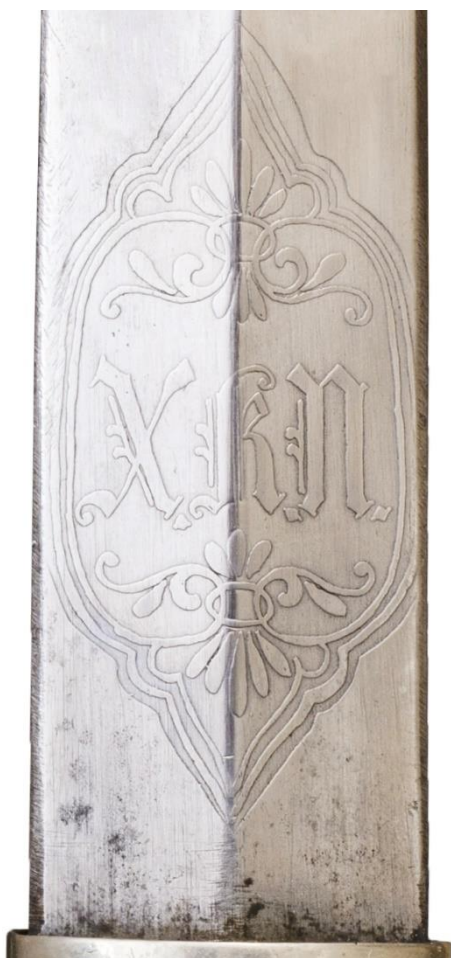
Илл. 4. Кинжал с ножнами. Кутаисская губерния (?) (клинок - Златоуст, 1890 год), конец XIX века. Частная коллекция. Картуш с полковой аббревиатурой.