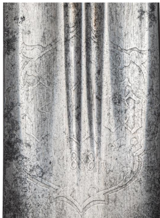
Илл. 13. Кинжал с ножнами, Закавказские губернии (?) (клинок - Златоуст, 1888 г.), 1894 г. Частная коллекция. Картуш с аббревиатурой фабрики.

ножен кубанских шашечных без оправы: оклеенных шагренью — 1 шт. по 1 руб. 50 коп., лакированных — 6 шт. по 1 руб. 20 коп. на 7 руб. 20 коп.;