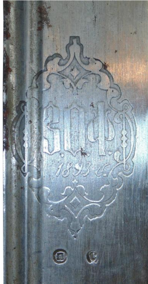
Илл. 9. Шашечный клинок, Златоуст, 1893 год. Частная коллекция. Картуш с аббревиатурой фабрики.