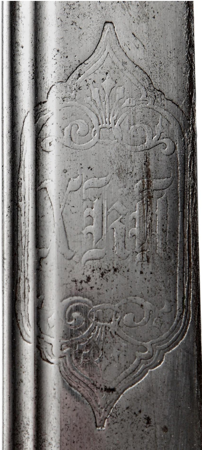
Илл. 2. Шашка с ножами. Кутаисская губерния (клинок - Златоуст), конец XIX века. Частная коллекция. Картуш с полковой аббревиатурой.