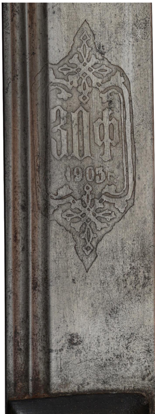
Илл. 26. Шашка с ножнами, Кубанская область, (клинок - Златоуст, 1903 год), начало XX века. Частная коллекция. Картуш с аббревиатурой фабрики.