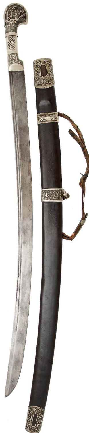
Илл. 28. Шашка с ножнами, Златоуст, 1900-е гг. Частная коллекция.