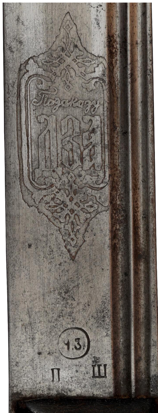
Илл. 27. Шашка с ножнами, Кубанская область, (клинок - Златоуст, 1903 год), начало XX века. Частная коллекция. Картуш с торговой маркой заказчика.