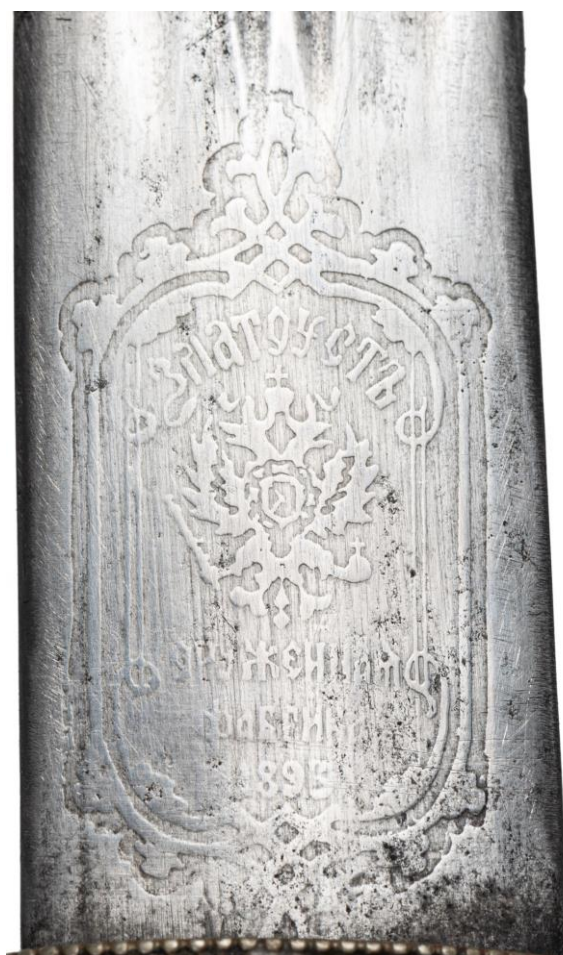
Илл 18. Кинжал с ножами, Кубанская обл. (клинок - Златоуст, 1893 г.), конец XIX в. Частная коллекция. Картуш с названием фабрики.