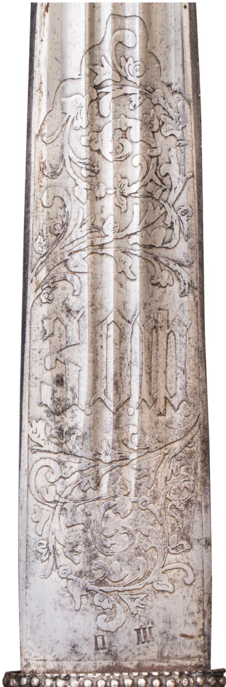
Илл. 33. Кинжал с ножнами, Карсская область (?), (клинок - Златоуст), начало XX в. Частная коллекция. Картуш с аббревиатурой фабрики.