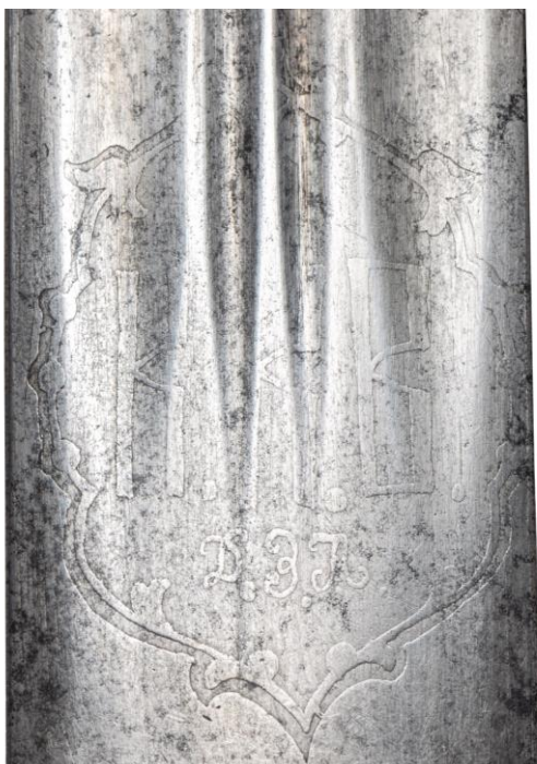
Илл. 12. Кинжал с ножнами, Закавказские губернии (?) (клинок - Златоуст, 1888 г.), 1894 г. Частная коллекция. Картуш с аббревиатурой войска и торговой маркой заказчика.