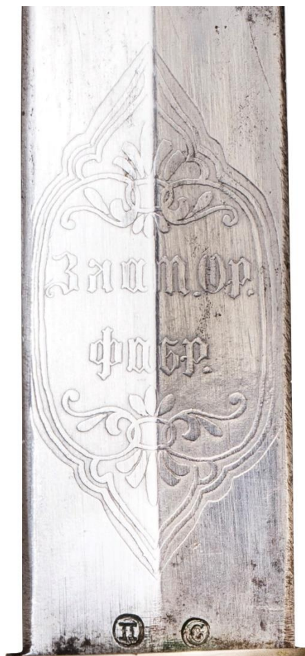
Илл. 5. Кинжал с ножнами. Кутаисская губерния (?) (клинок - Златоуст, 1890 год), конец XIX века. Частная коллекция. Картуш с сокращенным названием фабрики.

Также нам известен клинок с характерной для хоперских клинков формой боевого конца, но имеющий необычную деталь отделки — на обеих сторонах клинка от эфеса вдоль обуха идет один дол, ширина которого соответствует границам обоих узких по краям, и на некотором расстоянии от рукояти этот дол делится на два привычных узких дола. На основании этого