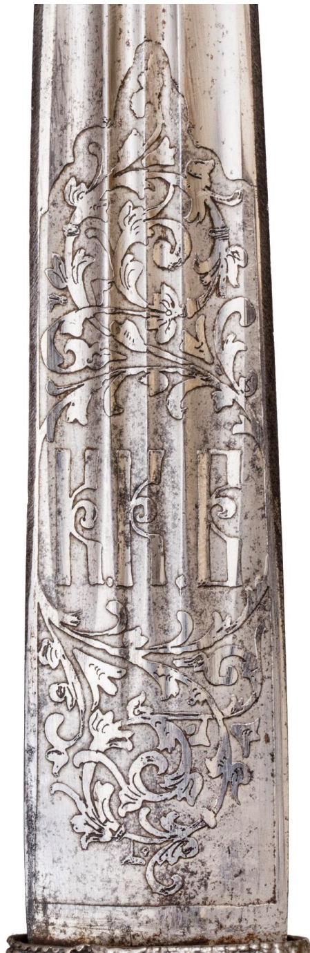
Илл 34. Кинжал с ножнами, Карсская область (?), (клинок - Златоуст), начало XX в. Частная коллекция. Картуш с аббревиатурой войска.