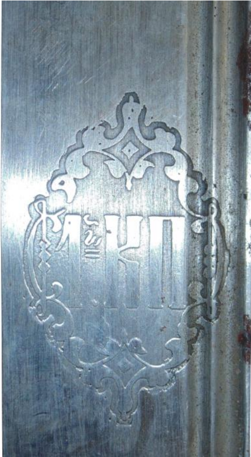
Илл. 8. Шашечный клинок, Златоуст, 1893 год. Частная коллекция. Картуш с полковой аббревиатурой.

клинков составила 2 руб. 80 коп. за штуку без стоимости пересылки 40 . Обратим внимание, что форма картуша на клинках, изготовленных в 1893 году для 1-го Кубанского конного полка, имеет отличие от формы стандартных картушей с аббревиатурой войска на этот год, при этом их геометрия и структура долов схожи с войсковыми клинками (Илл. № 8 и 9).