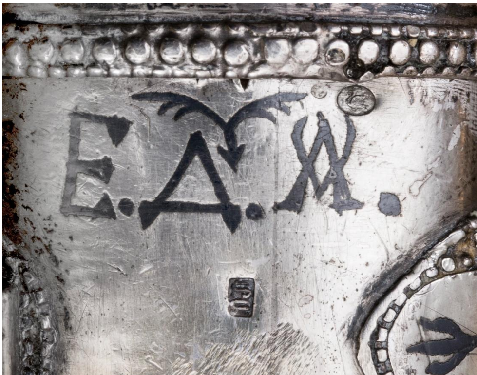
Илл. 32. Кинжал с ножнами, Карсская область (?) (клинок - Златоуст), начало XX века.

Частная коллекция. Клеймо с именем мастера.