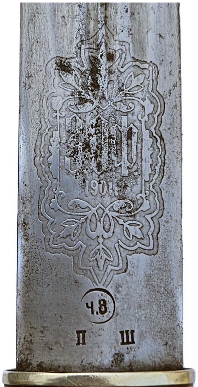
Илл. 21. Кинжал с ножнами, Кубанская область (клинок - Златоуст, 1901 год), начало XX века. Частная коллекция.