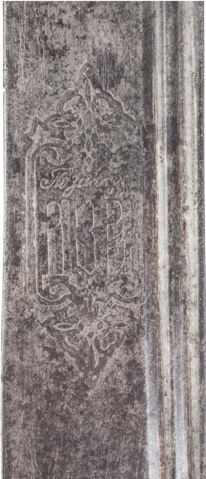
Илл. 10. Шашка с ножнами, Кубанская область (клинок - Златоуст, 1893 года), конец XIX века. Частная коллекция. Картуш с названием торговой марки заказчика.