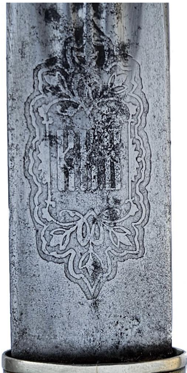
Илл. 22. Кинжал с ножнами, Кубанская область (клинок - Златоуст, 1901 год), начало XX века. Частная коллекция.