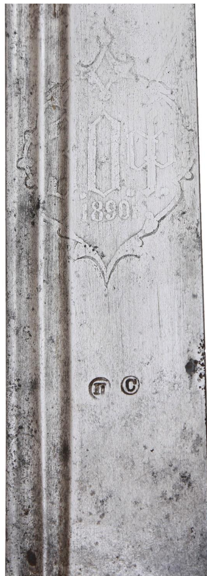
Илл. 16. Шашка без ножен, Кубанская область (клинок - Златоуст, 1890 г.), конец XIX в. Частная коллекция. Картуш с аббревиатурой фабрики.