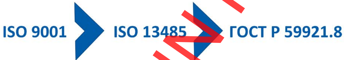
Рис. 2. Развитие отраслевых требований к системе менеджмента качества технологий искусственного интеллекта, являющихся медицинскими изделиями.