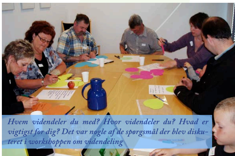
Hvem videndeler du med? Hvor videndeler du? Hvad er vigtigst for dig? Det var nogle af de spørgsmål der blev diskuteret i workshoppen om videndeling

Enkelte maXianere fortalte om, hvordan de bruger diabetes-chat, Facebook og andre teknologier til at dele viden om diabetes. Det blev diskuteret, hvem man deler viden med, hvad man deler viden om, og det hele blev tegnet op og sorteret på papstykker og sat op på et diagram, som gav et ret flot overblik over typer af videndeling.