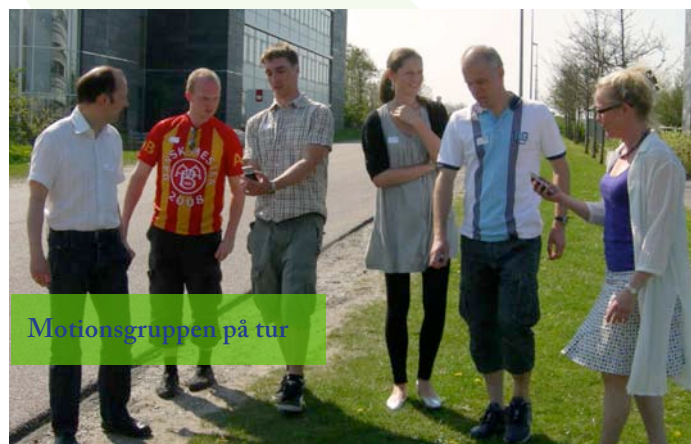
Motionsgruppen på tur

Aalborg Universitet og Teknologisk Institut viste nogle af de muligheder, der findes for it-støttet motion. En af løsningerne kom med på en gå-tur. Her prøvede vi teknologien og fik snakket om, hvad der er af særlige behov, hvis man er diabetiker.