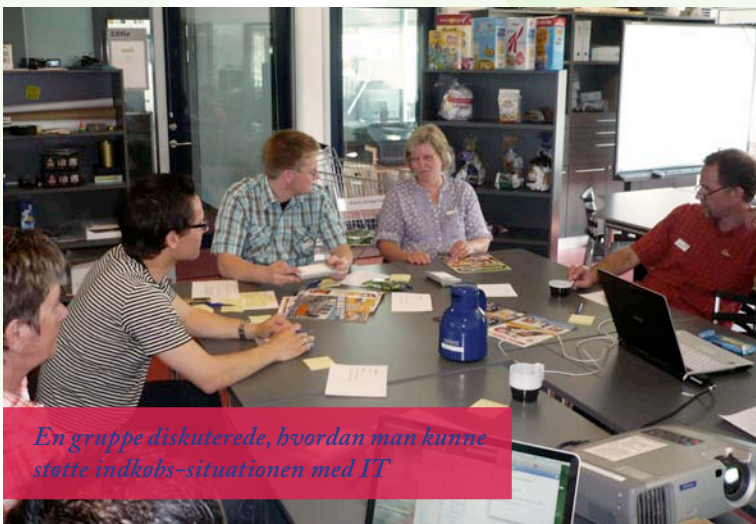
En gruppe diskuterede, hvordan man kunne støtte indkøbs-situationen med IT

Lørdag den 2. Maj 2009 mødtes maXi-familier, forskere fra Aalborg Universitet og konsulenter fra Teknologisk Institut til en workshop på Aalborg Universitet. Her samarbejdede vi om de idéer, som var kommet frem under hjemmebesøgene og spillet med maXi-maskinen. Målet var at samarbejde om, hvad der skal fokuseres på, når vi skal til Skagen i september. Alle familier var tilmeldte, og nogle havde taget ekstra familiemedlemmer med (bedsteforældre), så der var fuldt hus og god stemning. For at sikre at vi nåede rundt om flere emner, og for at sikre at alle kunne komme til orde, foregik workshoppen i fire spor: et om it-støttet indkøb, et om it-støttet motion, et om it-støttet videndeling og et om it-spil om diabetes.