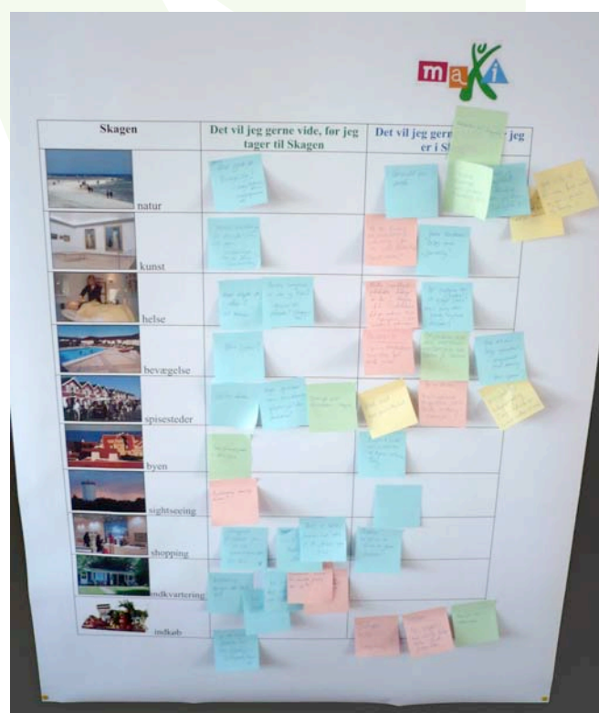
Idéer og ønsker til Skagen blev skrevet ned og sat på plakat.