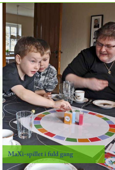
MaXi-spillet i fuld gang

Efter spillet fandt forskerne en stor værktøjskasse frem med papir, tusser, pap, gamle mobiltelefoner, modelervoks mm. Med de materialer lavede hver familie en gave, som de ville give til en nydiagnosticeret diabetiker.