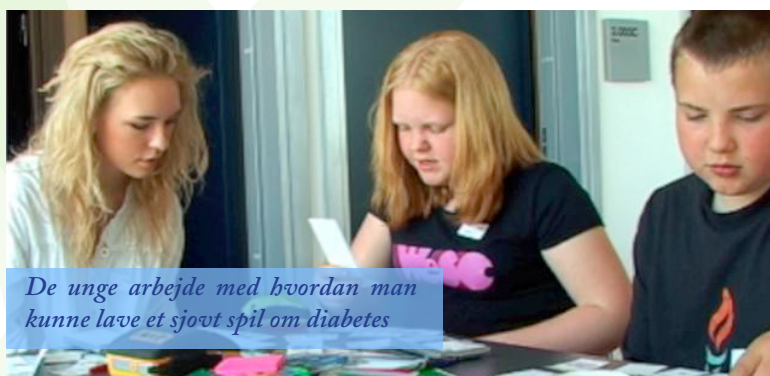
De unge arbejde med hvordan man kunne lave et sjovt spil om diabetes