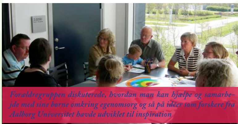
Forældregruppen diskuterede, hvordan man kan hjælpe og samarbejde med sine børn omkring egenomsorg og så på idéer som forskere fra Aalborg Universitet havde udviklet til inspiration

Aalborg Universitet præsenterede idéer og spørgsmål til spil, som kan støtte børn og unge med diabetes i den daglige egenomsorg. Forældre diskuterede i en gruppe med fokus på at få idéer og viden om, hvordan de lærer deres børn og samarbejder med deres børn om egenomsorg. Børn og unge arbejdede for sig med det, der gør et spil sjovt og kiggede på nogle af de forslag, som var lagt frem.