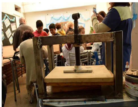
Foto 5: Tramo final de la actividad y confección de las estampas xilográficas para la exposición