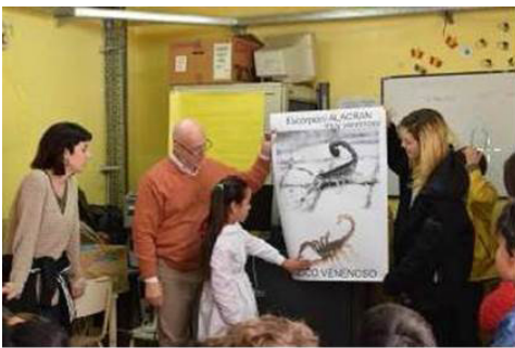
Foto 1: Docentes utilizando láminas explicativas sobre escorpiones

La metodología se mostró eficiente despertando interés y atención en los niños, por lo que se cumplieron los objetivos y se puede sostener que otro modo de enseñanza es posible y que tanto docentes como alumnos lograron ser sujetos de aprendizaje. El producto final, las estampas logradas por los alumnos primarios son los mejores logros; se pudo valorar un alto compromiso de los educadores afectados y gran disposición de los niños durante todo el proceso, siendo capaces de representar las características morfológicas de los escorpiones, dando grandes muestras de satisfacción a través de la expresión artística. (Fotos 1, 2, 3, 4).