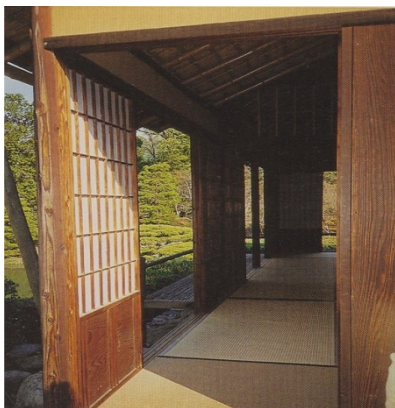
Figura 4. Detalle de la casa japonesa (Behling et al., 2002, p. 58).

Para la cultura japonesa (figura 4) y otras diferentes a la occidental, los materiales carecen de valor y los monumentos son destruidos y reconstruidos cada cierto número de años, siendo importante conservar sólo el lugar, y en todo caso, las formas, sin que ello suponga una merma de la autenticidad. Este fenómeno extraño a nuestra mentalidad, tiene su explicación en la naturaleza perecedera o poco resistente de los materiales en la construcción de sus monumentos, como madera o papel, en concordancia entre otras cosas con los fenómenos naturales en su área geográfica, como terremotos o huracanes. De ahí que el elemento intangible pero enraizado en su memoria, sea el factor perdurable y digno de conservación, no así la materia.