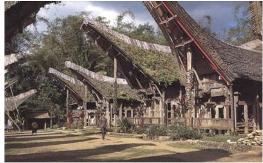
Figura 1. Casas en Sadan Toraja en Indonesia (Oliver, 1987, p.200).

teniendo en cuenta el cuerpo humano, el femenino, el masculino, o ambos a la vez. Construcciones muy descriptivas con el cuerpo humano se encuentran en África, al noreste de Togo, los Batammaliba, que construyen sus casas como una metáfora del ser humano que se rinde y adora sus divinidades. En este caso, la casa es por su simbolismo corpóreo, mucho más que una copia de la naturaleza. El antroporfismo de las viviendas Fali de Camerún (figura 2) y los Dogón (figura 3) de Mali organizan sus casas y poblados desde los referentes humanos.