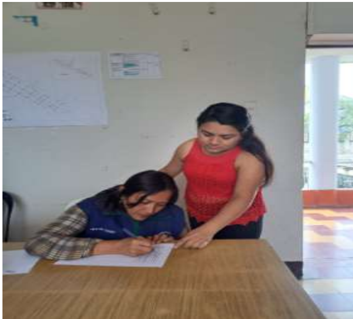
Imagen 3 y 4: desarrollo del cuestionario