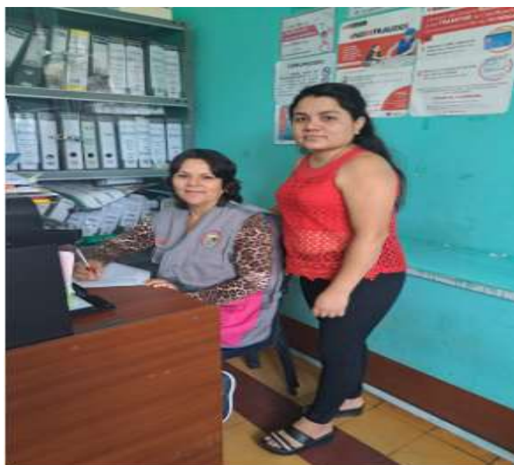
Imagen 1 y 2: Aplicación del cuestionario a los funcionarios de la municipalidad.