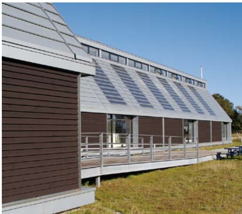
Fokus på elbesparelser og vedvarende elproduktion i dansk perspektiv. Samsø Energi-Akademi, Ballen, 2007.

AF ROB MARSH, ARKITEKT MAA PH.D., SENIORFORSKER, STATENS BYGGEFORSKNINGSINSTITUT, AALBORG UNIVERSITET