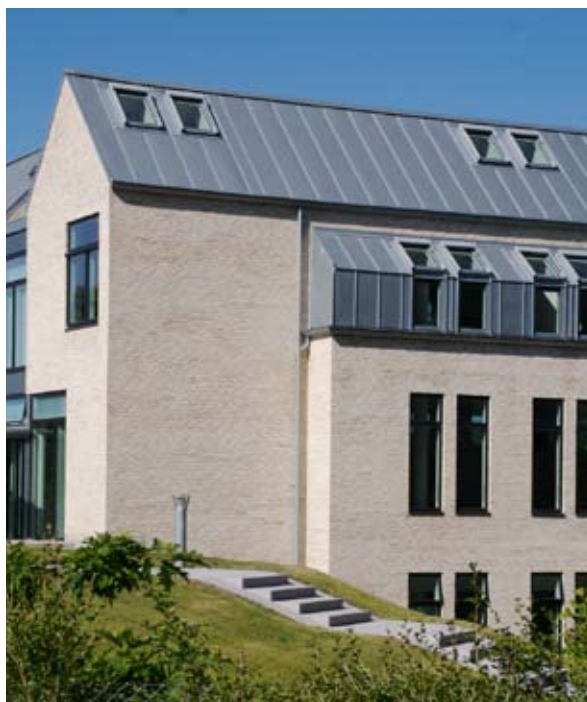
Naturlig dagslys, naturlig ventilation og solafskærmning for at minimere energiforbrug i et helhedsperspektiv. VKR Holding, Hørsholm, 2007.

Nye bygningers energiforbrug har gennemgået store forandringer siden 1970'ernes olie-krise, med en klar tendens til at el-forbruget vokser og varmemeforbruget falder.