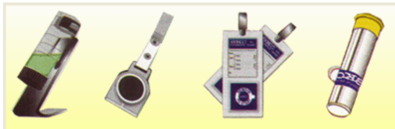
Figura 2. Muestreadores pasivos para vapores orgánicos, formaldehído, mercurio, etc