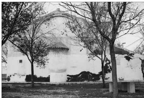
Fachada trasera con jardín en su entorno.