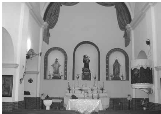
Cortavientos de la entrada principal