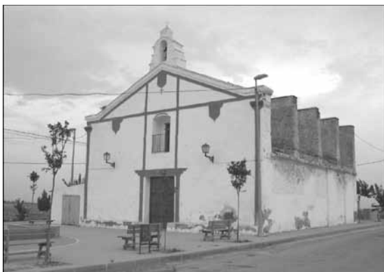
Fachada principal de la ermita