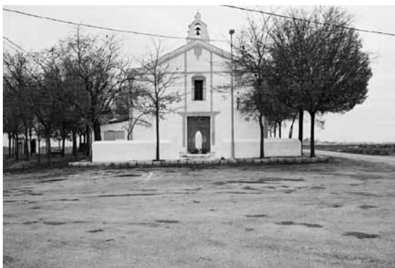
Fachada principal con atrio en la entrada