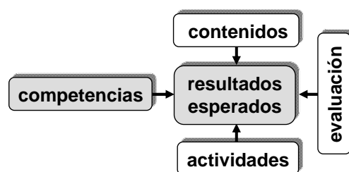
Figura 2. Planificación del proceso de enseñanza-aprendizaje