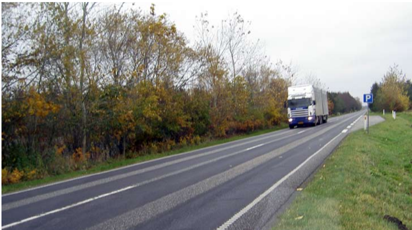
Udpeget trafikfarlig skolevej i Herning Kommune. Vejen fungerer som skolevej for 5-10 elever.