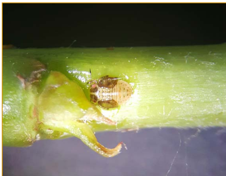
Ninfa de 4º estado de sila del peral

Para que los tratamientos sean eficaces, es conveniente eliminar previamente a estos la melaza que este insecto produce, así como mojar de forma adecuada toda la copa de los árboles empleando para ello altos volúmenes de caldo en las aplicaciones.