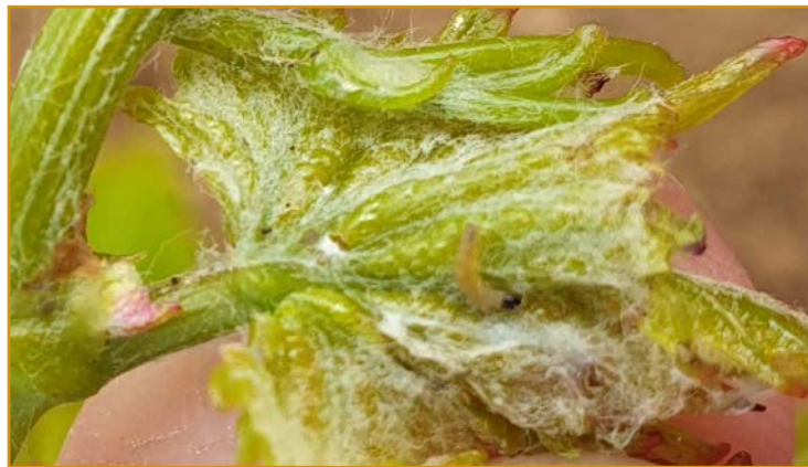
Larva de piral (primeros estadios).

Las larvas son las que causan los daños al alimentarse, y en sus primeros estadios es cuando presentan más sensibilidad a los tratamientos. Solo se recomienda tratar las viñas que tuvieran 5 larvas o más por cepa la campaña pasada. El éxito del tratamiento se basa en su correcto posicionamiento: es muy importante la vigilancia de las parcelas y la detección temprana de las larvas. El tratamiento se recomienda realizarlo una semana después de ver la primera larva L1 o L2 (foto). El umbral de tratamiento será valorado por el técnico de ATRIA. En parcelas con ataques severos el año anterior, se aconseja repetir el tratamiento a los 15 días.