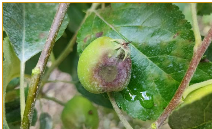
Síntomas de moteado en hoja y fruto de manzano

Existen 3 tipos de tratamientos: Aquellos que se efectúan con tiempo seco en previsión de que llueva o haya rocío se denominan preventivos. Los de "stop" son los llevados a cabo en las 36 horas posteriores al comienzo de la lluvia con fungicidas penetrantes y los curativos son aquellos que se hacen con fungicidas penetrantes o sistémicos, teóricamente capaces de impedir la progresión del hongo pasadas las 36 horas siguientes al inicio del riesgo.