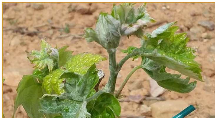
Brote con oídio

En parcelas que tuvieron oídio el año pasado y en viñas de variedades sensibles (Cariñena, Chardonnay, Cabernet Sauvignon...) el primer tratamiento (brotes de 5-10 centímetros) es imprescindible,