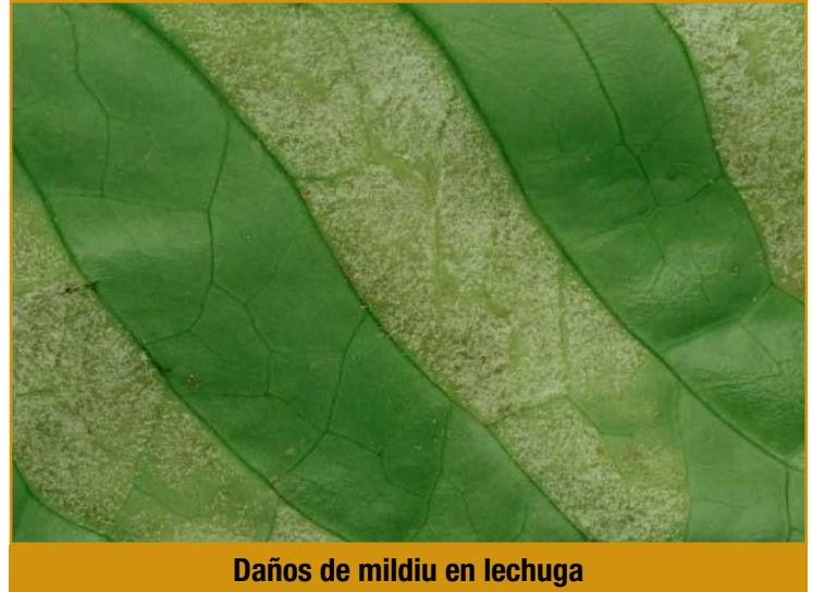
Daños de mildiu en lechuga