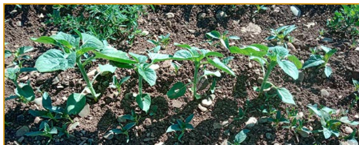
Infestación de Datura stramonium en girasol.

En caso de tener Amaranthus palmeri en algún campo se recomienda evitar sembrar girasol ya que las materias activas regis-