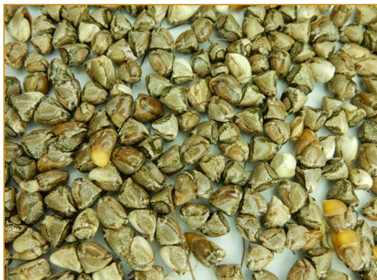
Semillas de teosinte

Para más información ver Hojas de Informaciones Técnicas del Centro de Sanidad y Certificación Vegetal.