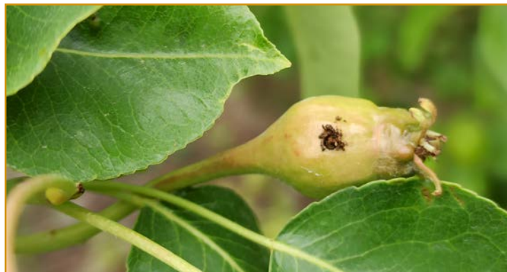
Pera atacada por hoplocampa

Aquellas parcelas con poca floración y con daños producidos por esta plaga en campañas previas pueden sufrir la pérdida de un porcentaje alto de la cosecha debido a este insecto, por lo que se recomienda realizar un tratamiento en estado de "botón blanco" con deltametrin 1,57%SC, 2,5%EC, 2,5%EW (varios). Aunque no es recomendable realizar tratamientos con insecticidas durante la floración, en caso de que la presión de esta plaga sea muy elevada y haya que tratar, en este periodo también puede emplearse flupiradifurona 20%SL (SIVANTO PRIME-Bayer) debiendo tener en cuenta sus condiciones de aplicación.