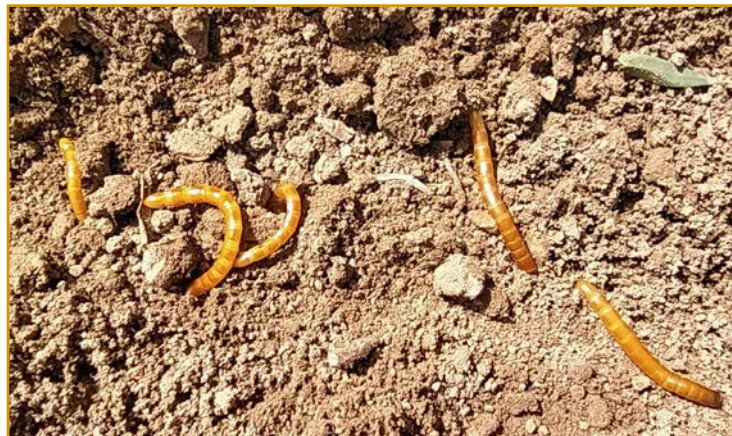
Gusano de alambre en su fase larvaria

En el seguimiento para las larvas se puede poner trampas con cebo alimenticio. Los adultos se podrán monitorear con trampas con feromonas.