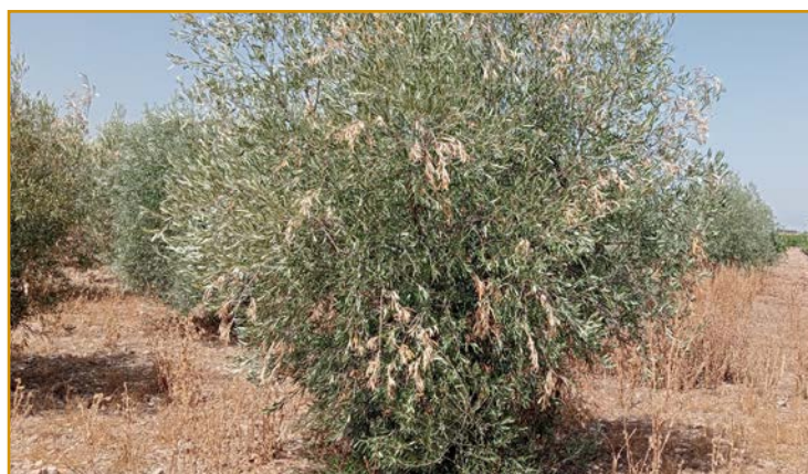
Olivo afectado por barrenillo negro

La estrategia de control del barrenillo negro ( Hylesinus oleiperda ) es diferente, puesto que pasa la mayor parte del año en el interior de la madera. Si se detecta su presencia por el secado de ramillas jóvenes de 2 a 3 años de edad (ver foto), hay que controlar la salida de adultos de la madera y realizar una aplicación con insecticida cuando estén todos fuera. Desde el CSCV se dará el pertinente aviso para realizar el tratamiento.