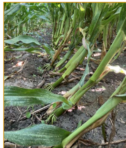
Daños de diabrótica en plantas de maíz

El método más eficaz y rentable para el control de esta plaga, es la rotación de cultivos, tanto sembrando otros cultivos como dejando en barbechos aquellas parcelas con mayor afección.