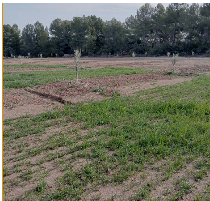
Cubierta de cereal en olivar joven extensivo donde se aprecia cómo la cubierta favorece que no haya pérdida de suelo por erosión.