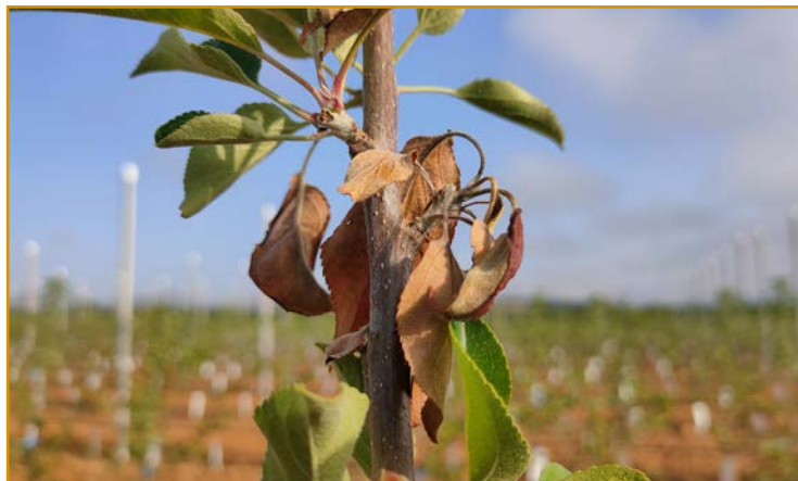
Síntomas de fuego bacteriano en manzano

La época de la floración, tanto principal como secundaria, es uno de los periodos de mayor riesgo de infecciones, por lo que en aquellas parcelas en las que se dé un elevado riesgo de contaminación se pueden realizar tratamientos de manera preventiva con alguno de los siguientes productos: Aureobasidium pullulans* 25+25%WG (BLOSSOM PROTECT-Andermatt), Bacillus amyloliquefaciens* 25%WG (AMYLO-X WG-Certis Belchim), Bacillus subtilis* 1,34%SC (SERENA-