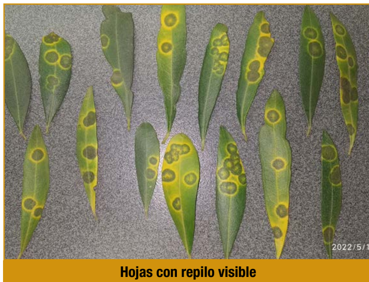
Hojas con repilo visible