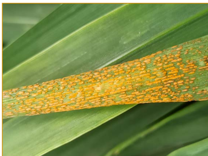
Daños de Puccinia striiformis en cereal

Enfermedad que afecta a las gramíneas, principalmente trigo y triticale. Se desarrolla con temperaturas de 10-12 °C y humedad relativa alta.