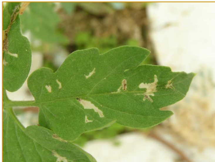
Daños de Tuta absoluta en hoja