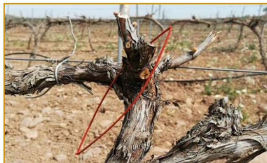
Difusor de feromona

En las denominaciones de Campo de Borja y Cariñena, así como en gran parte de la D.O. de Calatayud y otras zonas vitícolas de Aragón, está implantado el método de confusión sexual mediante puntos de difusión en la viña con buenos resultados. Suelen ponerse en abril, ya que deben estar colocados antes de comenzar el vuelo de adultos de la primera generación. No obstante, durante la campaña hay que continuar la vigilancia por si fuese necesario realizar algún tratamiento adicional.