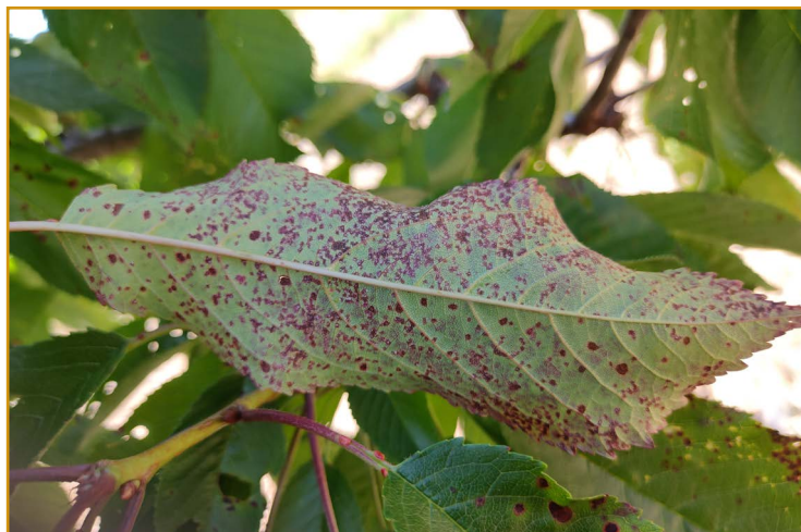
Cilindrosporiosis en el envés de la hoja

En caso de que tras la caída de pétalos se produjeran lluvias, sería necesario realizar tratamientos contra cilindrosporiosis y cribado con captan 80%WG (varios), dodina 40%SC (CAIREL-Tradecorp y SAMSH-Ascenza), dodina 54,4%SC (SYLLIT MAX-UPL) y tebuconazol 25%WG (FOLICUR 25 WG-Bayer).