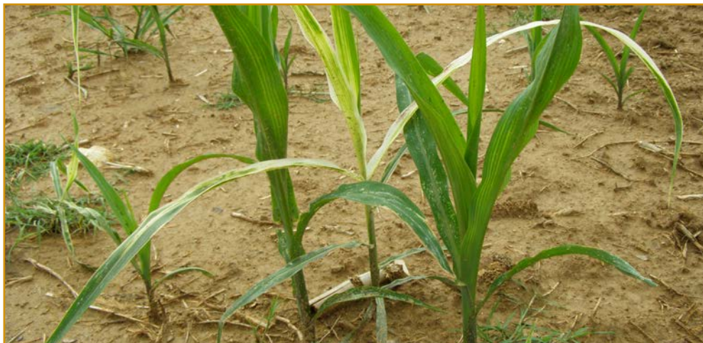
Imagen izda.: rizoma de Sorghum halepense y planta con fitotoxicidad por herbicidas entre cultivo de maíz (dcha.).