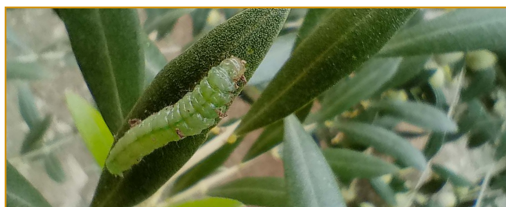
Larva de glifodes

En plantaciones jóvenes se recomienda realizar un tratamiento si se observan daños recientes en los brotes. En plantaciones adultas solo se recomienda tratar en caso de ataques muy severos.