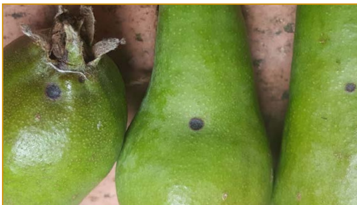
Daños de S. vesicarium en peral

En el caso de que se den condiciones adecuadas para el desarrollo de septoria, especialmente aquellas parcelas que hayan presentado síntomas de esta enfermedad en años anteriores, deben protegerse realizando aplicaciones con difenoconazol 25% EC (varios). Existen productos empleados para el control de otras enfermedades de este cultivo como el moteado o la mancha negra que pueden tener efecto sobre este hongo.