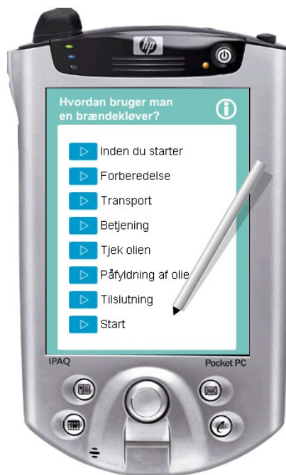
Illustration 1: Eksempel på kursusindhold på PDA ved e-læringsforløb hos Erhvervsskolerne Aars.