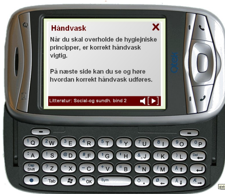
Illustration 2: Eksempel på en kort instruktion, der kan læses op, og som umiddelbart efterfølges af en videosekvens.

I projektet hos Københavns Universitet blev den mobile enhed anvendt som støtte til læsesvage voksne på en anden måde end i de to foregående beskrevne eksempler. PDA'en kunne anvendes til kompensering for ordblindhed, idet oplæsning af for eksempel byggeanvisninger kunne affotograferes med den mobile enhed, hvorefter et udsnit af teksten kunne markeres og efterfølgende læses op. Den kompenserende teknologi fungerede som en stor hjælp for deltagerne under udførelsen af deres arbejde.