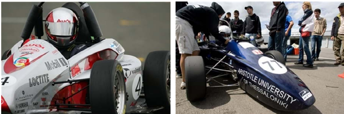
Figura 1: Formula Student.

A título ilustrativo, en la Figura 1 se muestra un ejemplo de los prototipos diseñados para la competición internacional “Formula Student”. Esta competición es dirigida a la identificación de jóvenes talentos en el campo de la ingeniería industrial, mecánica y electrónica mediante el desarrollo de coches de carreras monoplace, incluyendo no sólo el diseño del producto sino también la fabricación del conjunto, la optimización económica y el despliegue de las habilidades del equipo, aspectos de vital relevancia para el mercado actual y que implican la combinación de diferentes ámbitos profesionales. En la Figura 1 se muestra un ejemplo de los prototipos de automóviles de carreras que han sido presentados en las recientes ediciones de la competición internacional “Formula Student”. Esta competición es organizada por la Institution of Mechanical Engineers (IMechE), con sede en Londres (Reino Unido), y cuenta con destacadas compañías patrocinadoras tales como Airbus, Alstom, Honda Racing F1 Team, Toyota y Autodesk.