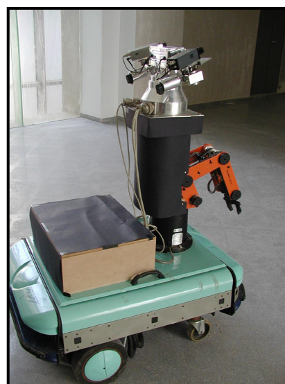
Figura 1. Robot CARTHAGO

Para la construcción del robot móvil CARTHAGO, figura 1, se han tenido en cuenta los requisitos funcionales, incorporando un conjunto de sensores externos (visuales, táctiles, ultrasónicos y de contacto) y un sistema de comunicación que permite la transmisión bidireccional de comandos de movimiento y estímulos percibidos, mediante tecnologías basadas en TCP/IP para la configuración de redes LAN inalámbricas y/o a través de Internet.