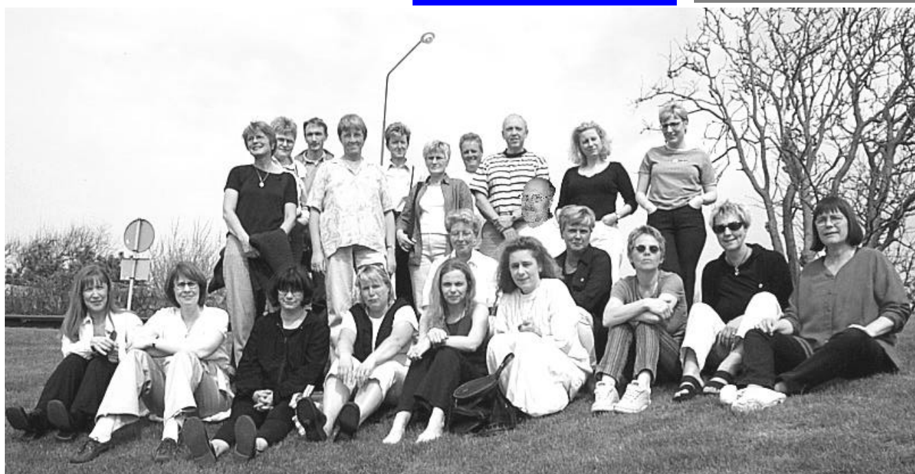
Utflyttad Dagverksamhet på planeringsdagar i Tylösand