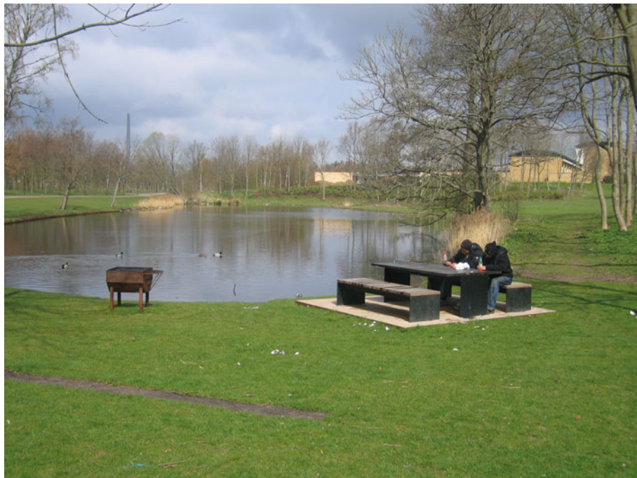
De unge er storforbrugere af de grønne områder.

fri for den stærke sociale kontrol, som de synes er gældende i de nære omgivelser inde i boligområderne.