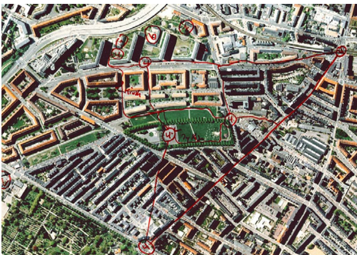
De unge fik udleveret et lamineret luftfoto, hvor de indtegnede deres ruter og opholdssteder.

Der blev ikke anvendt båndoptager under gåturene med de unge. De unges fortællinger om hverdagsliv og udeliv i boligområderne blev derfor umiddelbart efter gåturene nedskrevet i resuméform.