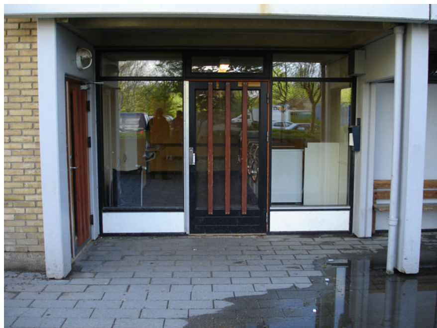
Et af ungdommens foretrukne steder kan i en periode være foran vaskeriet.

I tillæg til de beskrevne steder, som ungdommen anvender, eksisterer der steder som ungdommen selv tager i besiddelse. Det er de unges egne steder, og som henviser til steder, som godt nok er steder for ungdommen, men som ikke er steder bestemt for specifikke funktioner eller formål set ud fra gængse voksennormer. Disse steder kan være faste tilholdssteder over en længere periode eller det kan være steder, der benyttes i en kortere periode.