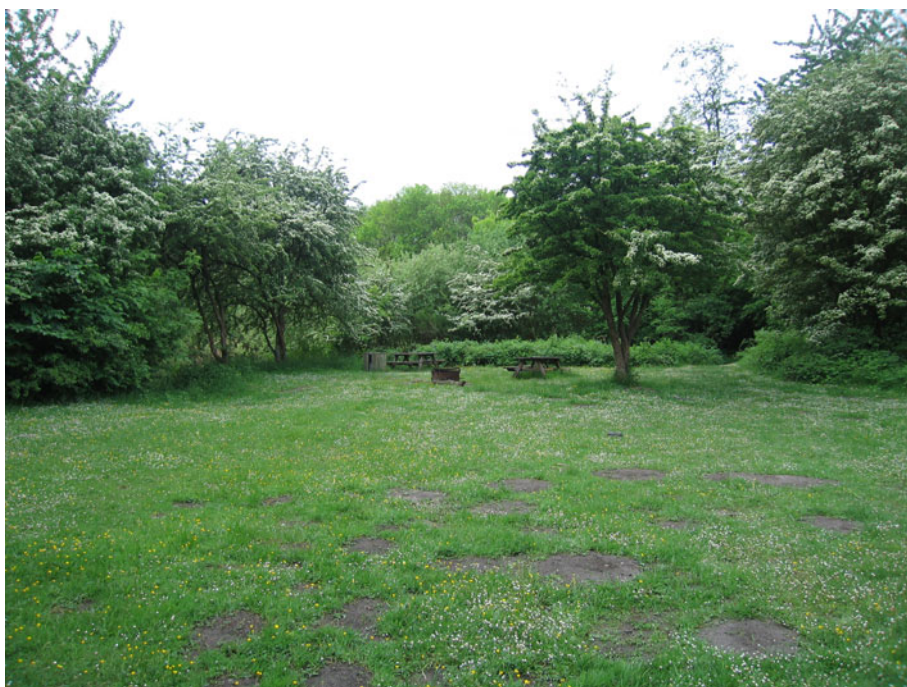
Her i 'Mosen' kan de unge være for sig selv.

Behovet for egne steder fremføres ofte af de unge, og de unge har da også selv fundet frem til nogle steder i Vollsmose, hvor de kan være for sig selv. Et grønt, kuperet område, nær Centret kaldet 'hullet' bliver anvendt som mødested af drengene, og i 'mosen', et tidligere moseområde, som nu er omdannet med mindre søer og tæt bevoksning liggende i parkområdet, har de unge fundet nogle pladser, hvor de kan hygge sig, tage sig en smøg og mødes med kæresten. Her findes et par nedslidte borde og bænke, som de unge kan samles omkring. Det er også i dette område, der af og til har været nogle uheldige episoder med ildspåsættelser af gangbroer, knallerter m.v.