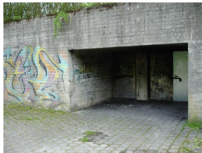
Eksempler på ungdommens egne steder