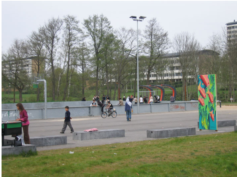
Idrætslegepladsen i Vollsmose. Et aktivitets- og samlingssted for både piger og drenge.

Som noget unikt ligger der midt i Vollsmose en stor grønt, kommunalt parkområde. De seneste år er der sket en række nye kommunale tiltag og indsatser. Nye stier er anlagt, søerne er blevet rensset, det grønne er blevet beskåret, grillpladser er blevet placeret rundt i området, og ikke mindst er en ny meget populær idrætslegeplads blevet anlagt. Dette parkområde benyttes flittigt af beboerne, de lokale skoler og børnehaver - og ikke mindst af de unge.