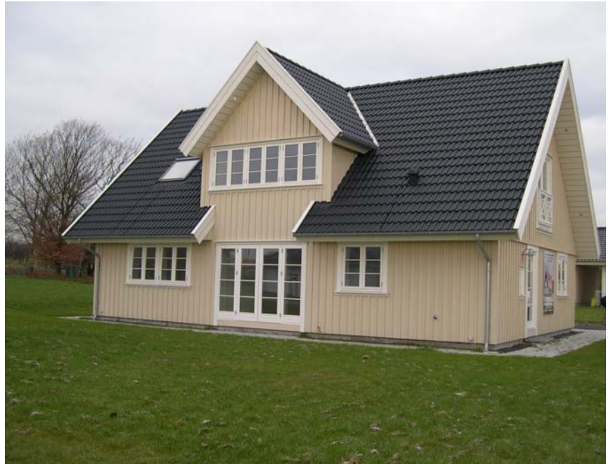
Facade mod have.

Huset er opført som et super lavenergihus med højisolering klimaskærm; Ydervægge er isoleret med 300-400 mm, klasse 34 isolering. Gulvkonstruktion er isoleret med 400 mm isolering klasse 37. Loftkonstruktion er isoleret med 400-600 mm, klasse 34 isolering. Yderligere er der anvendt 3-lags superlavenergi vinduer med kryptonfyldning, U-glas = 0,61. Huset