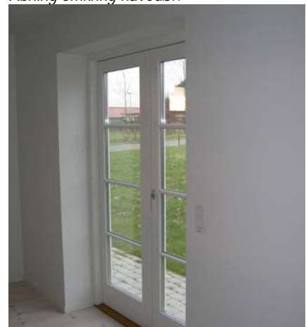
Åbning omkring havedør.