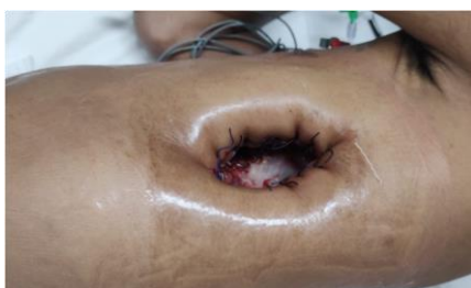
Figura 4: Pleurostomia esquerda com costectomia de 3 arcos costais esquerdos