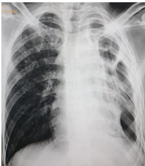
Figura 2: Drenagem pleural fechada

COSTECTOMIA EM TUBERCULOSE PULMONAR COM HIDROPNEUMOTÓRAX: UM RELATO DE CASO Camila de Santana Marinho, João Paulo Vieira, Cláudia Gonçalves Magalhães, Laura Magalhães Reiff, Juliana Domith de Oliveira Vieira