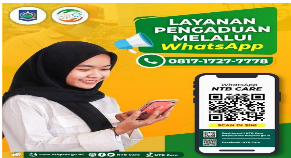
Gambar 2. layanan pengaduan Masyarakat

Gambar di atas menjelaskan tentang aplikasi NTB Care. Jika masyarakat NTB ingin melaporkan suatu kejadian yang melibatkan pelayanan publik di bidang pembatasan nontarif, masyarakat dapat mencari dengan istilah pencarian “NTB Peduli” dan akan langsung muncul website NTB Peduli. situs ini memiliki dashboard, keluhan, berita, kisah sukses, dan survei. Kepada masyarakat Untuk menyampaikan pengaduan, masyarakat wajib mengisi kolom laporan dan mengirimkannya secara rinci dan lengkap, meliputi uraian laporan, tanggal dan tempat kejadian, landasan, kategori yang disampaikan. pengaduan, foto kejadian dan dokumen lalu ajukan pengaduan. Selain pengaduan pelayanan publik, NTB Care juga menyampaikan potensi pengaduan pelayanan publik yang melanggar hukum atau diduga melakukan tindak pidana, dan manajemen NTB Care memantau sistem pelaporan pelanggaran ( whistleblowing system ). Sistem ini merupakan suatu mekanisme pelaporan kejahatan dalam kegiatan tertentu yang melibatkan pegawai dan individu lain dalam organisasi tempatnya bekerja, ketika pelapor tersebut bukan termasuk pelaku kejahatan yang dilaporkan.