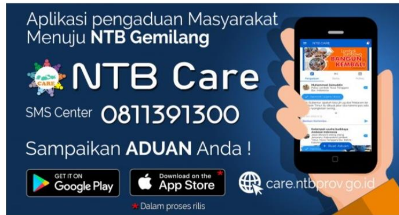
Gambar 1. Tampilan Aplikasi NTB Care