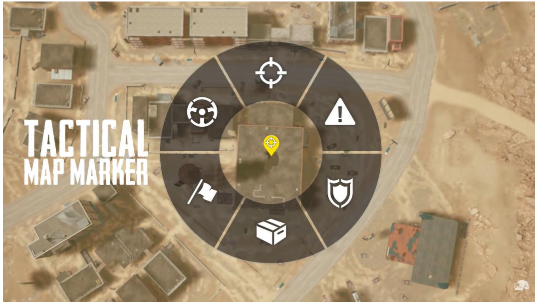
Gambar 2. Simbol tactical map marker

Fitur ini berisi simbol-simbol tertentu dan setiap simbolnya memiliki arti tersendiri. Fitur ini dapat membantu para pemainnya untuk berkomunikasi nonverbal dengan rekan satu tim.