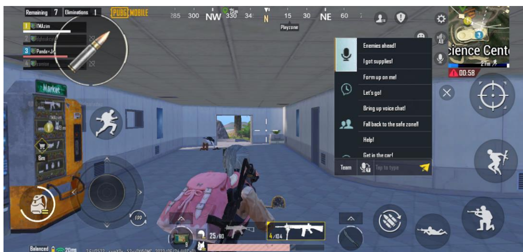
Gambar 1. Pilihan quick chat

Sama seperti namanya, quick chat berarti obrolan cepat, yang berisi pesan-pesan singkat yang bisa digunakan para pemain untuk mengirim informasi ke teman satu tim dengan cepat. Fitur ini digunakan oleh para anggota DEOXYE E-Sports untuk membantu mereka dalam melakukan komunikasi verbal ketika di dalam permainan. Karena hanya berisi pesan-pesan singkat, isi dari pesannya pun juga tidak terlalu panjang