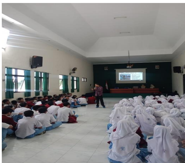
Gambar 4. Pemaparan Materi Pembuatan Sabun Cuci Piring Berbahan Dasar Eco-Enzyme

piring, dilakukan dengan cara memasukkan 5 gram Methyl Ester Sulfonate (MES) ke dalam 25 ml air, diaduk terus hingga semua homogen. Fungsi penambahan MES adalah menggabungkan unsur minyak pada eco-enzyme dan air. Setelah itu, dipanaskan pada suhu 60 derajat celsius sambil diaduk selama 1 menit hingga berubah menjadi berwarna bening, kemudian NaCl atau garam dapur sebanyak 5 gram dimasukkan pada 25 ml air dan diaduk. Fungsi penambahan NaCl atau garam dapur adalah untuk menentukan kekentalan sabun cuci piring. NaCl yang larut dicampurkan ke dalam larutan MES sambil terus diaduk, kemudian memasukkan 5 gram gliserin dan 5 ml foam booster ke dalam larutan. Fungsi foam booster adalah untuk menghasilkan busa yang banyak dan fungsi penambahan gliserin adalah agar kulit tidak terasa kering (Iswati et al., 2021). Setelah itu memasukkan 75 ml air bersih. Jika sudah dingin kemudian memasukkan pewangi 5 ml dan eco-enzyme 100 ml, untuk aroma pewangi bisa disesuaikan dengan aroma yang diinginkan. Tahap terakhir adalah memasukkan ke botol pump dan diberi label nama kelompok.