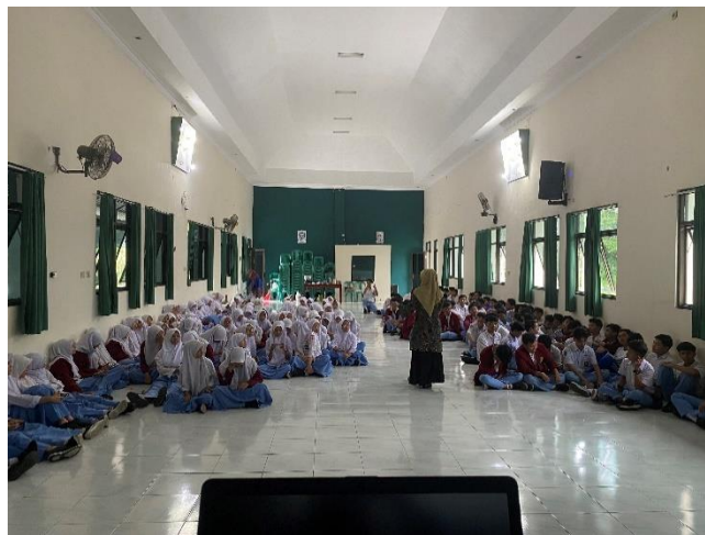
Gambar 3. Sosialisasi Produksi Eco-Enzyme oleh Tim Pengusul

Gerakan Indonesia Bersih merupakan salah satu pilar dari 5 Gerakan Nasional Revolusi Mental (GNRM) yang dapat menjadi gerakan sosial kolaboratif masyarakat untuk mengambil peran dalam mengelola sampah. Siswa akan memahami bahwa pengelolaan sampah dapat dilakukan salah satu caranya dengan pembuatan eco-enzyme . Eco-enzyme adalah alternatif alami dalam penanggulangan penumpukan limbah sampah di TPA. Sebagian besar produk yang digunakan di sekolah terbuat dari bahan kimia, dan produk yang terbuat dari bahan kimia sintetis berbahaya bagi kesehatan manusia dan lingkungan. Selain itu, kemasan produk berbahan kimia dapat mencemari lingkungan karena hanya sebagian kecil yang didaur ulang.