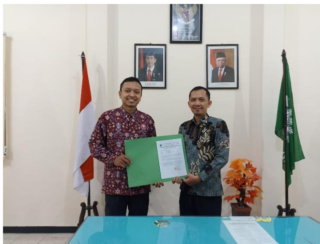
Gambar 2. Kerjasama Tim Pengusul PKMS dengan Mitra Kepala Sekolah SMAM 3 Jember

Kegiatan pengabdian ini dilaksanakan di SMAM 3 Jember. Sebanyak sekitar 100 peserta hadir dan antusias mengikuti sosialisasi. Berdasarkan informasi dari pihak mitra SMAM 3 Jember, selama ini siswa belum pernah mendapatkan informasi tentang produk eco-enzyme sebagai pengolahan sampah menjadi inovasi produk yang bermanfaat, sehingga layanan yang meliputi penyuluhan dan pendampingan ini sangat bermanfaat bagi siswa. Kegiatan penyuluhan berjalan lancar selama acara berlangsung. Sebelum pemaparan materi dimulai, para siswa SMAM 3 Jember mengerjakan soal pre-test menggunakan google form yang telah dibagikan oleh pengusul. Kegiatan ini bertujuan untuk menilai seberapa jauh pengetahuan siswa terkait limbah sampah organik, eco-enzyme , dan produk olahannya.