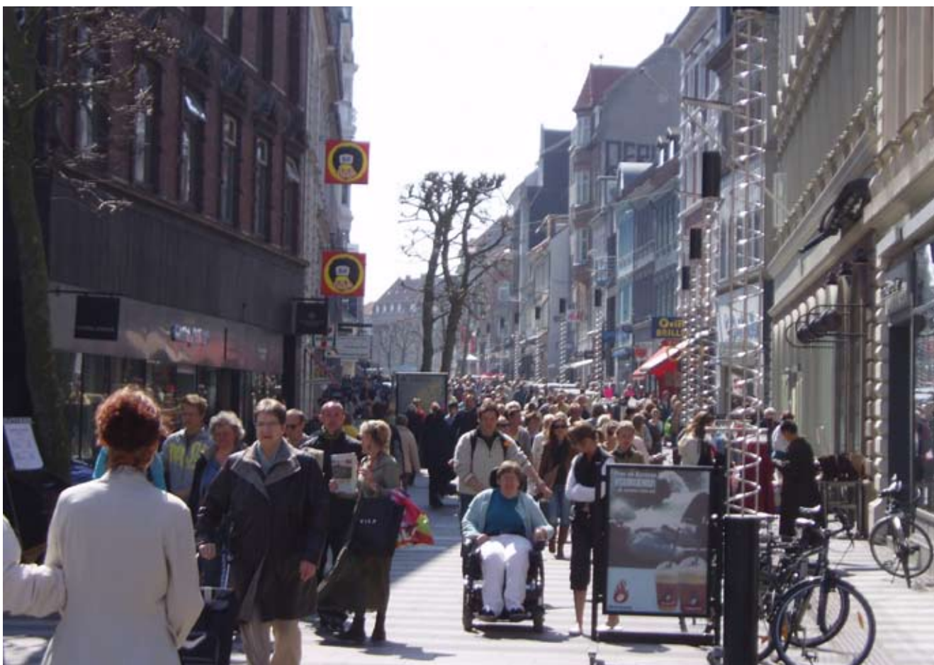
Byernes succes indebærer et øget brug af byens forskellige steder og byrum. Det betyder større slid og forudsætter løbende vedligeholdelse, istandsættelse og fornyelse. Her Søndergade - Strøget i Århus.

De mange funktionsblandede byrum indfrier målet om, at byrum principielt indrettes til almenvællets brug. Alligevel har man som byplanlægger ofte bestemte brugere i tankerne og nogle steder arbejder man bevidst på at lave byrum, som appellerer til udvalgte grupper. For selvom det overordnede mål er at lave fleksible, mangfoldige og multikulturelle byrum, er det svært at skabe "fælles rum" i en tid præget