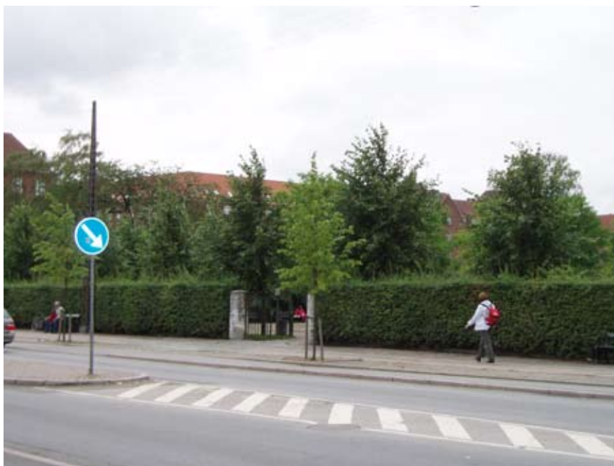
Høje træer, tætte buske og steder som er uoverskuelige skaber utryghed fordi man frygter, at nogen kan ligge gemt bag en busk. Her Enghaven i København.

trygheden, og manglende vedligeholdelse, f.eks. affald, der ligger og flyder, ødelagte bænke, smadrede ruder, hærværk, graffiti og andre tegn på kriminalitet, føles utrygt. Øde områder og små gader uden mennesker opleves også som utrygge.