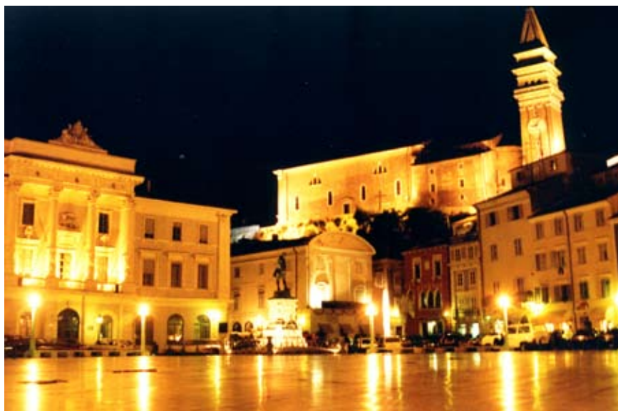
Den gode plads. Her Piran i Slovenien.

er mangfoldige, multikulturelle og fleksible, som kan imødekomme forskellige brugeres behov og give mulighed for vekslende aktiviteter. Det indebærer, at brug og brugere skifter, hvilket er attraktivt for nogle, men kan skabe utryghed for andre.