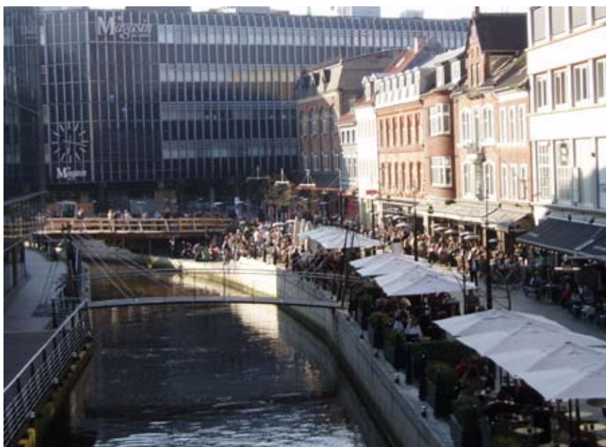
Ved Vadestedet ligger cafeer og restauranter side om side.

"utryghedsskabende unge". Hvis man tager højde for, at der færdes mange mennesker i området, er forekomsten af kriminalitet lav. Brugere beskriver området Vadestedet - Skt. Clemens Torv/Bro, som et trygt område og som "gode steder" at opholde sig.