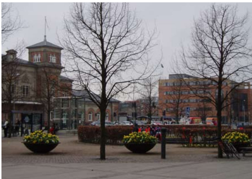
Kennedy Plads er primært opholdssted for byens udsatte grupper.

Bispensgade er en aktiv strøggade med specialforretninger, caféer og et pulserende folkeliv. Bispensgade er et sted man slentrer, shopper, "ser" og oplever byen. En sidegade til Bispensgade er Jomfru Ane Gade med mange restauranter og diskoteker, populære steder, som de unge flittigt besøger. Jomfru Ane Gade og strøget gennem