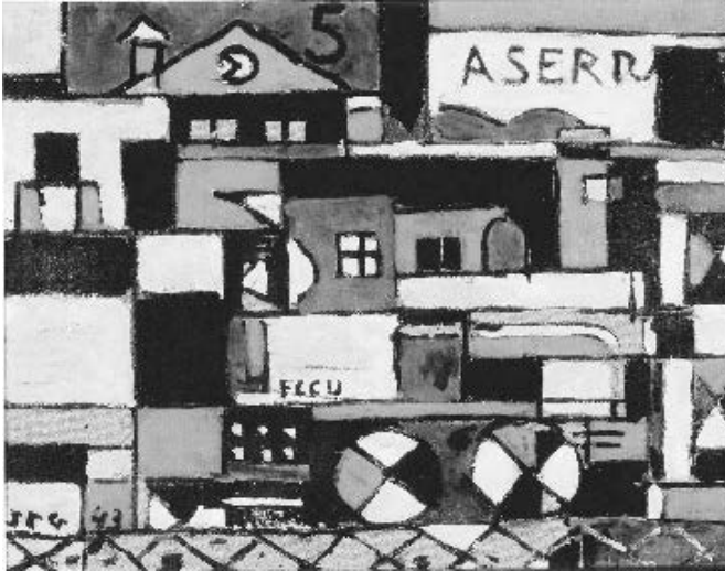
FIGURA 6. FERROCARRIL CONSTRUCTIVO SOBRE PUENTE METÁLICO, 1943.