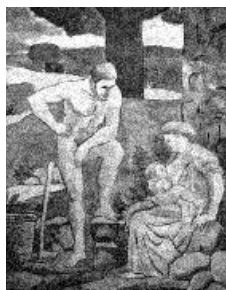
FIGURA 7. MATERNIDAD. CASMU N° 3, MONTEVIDEO.