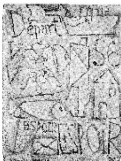
FIGURA 3. SIN TÍTULO, 1930.