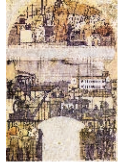
FIGURA 5. PROYECTO DEL FRESCO LA CATALUNYA INDUSTRIAL, 1917.

treinta años después parte de la escena de L'État d'Or de la Humanitat , esbozado en 1914. Torres pintó esta última maternidad «noucentista» en Montevideo a los setenta años; moriría cinco años más tarde.