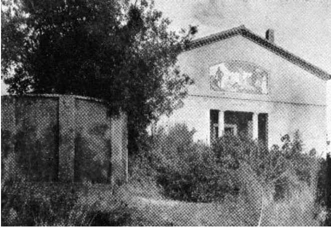
FIGURA 2. MON REPÓS, TERRASSA.

los— están presentes en la obra bonetiana, como en ciertos detalles de la Solana del Mar, de 1945 en adelante, pero también más literalmente en Dieste, como en la iglesia de Atlántida y en su propia casa. No sería la única fuente: Serralta trajo la primicia de los vitrales de Ronchamp en 1950.