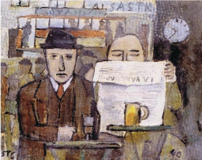
FIGURA 9. MESA DE CAFÉ CON HOMBRE LEYENDO, 1940.