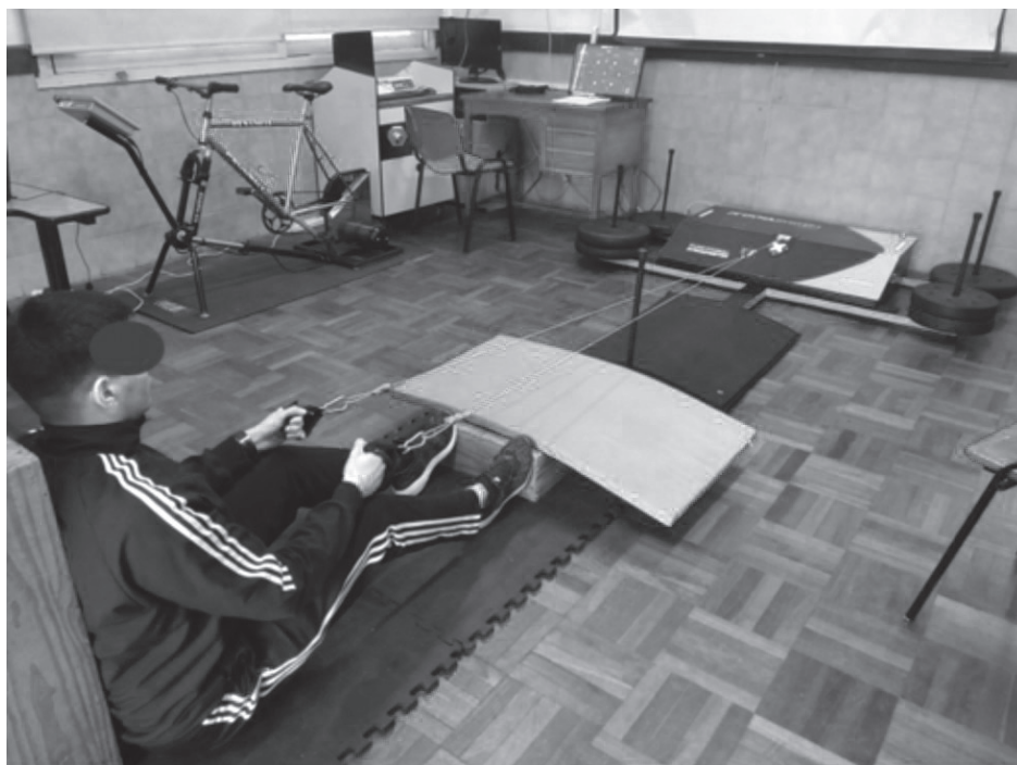
Figura 3. Evaluación de fuerza y potencia con dinamometría electromecánica funcional.

Por otra parte, para el grupo de investigación supone una toma de datos relevante de cara a la investigación, puesto que estas evaluaciones, cuando son desarrolladas en equipos de primer nivel, pueden generar datos que respondan preguntas de diferentes proyectos de investigación vinculados al alto rendimiento en Uruguay. Consideramos que, en estos casos, se conjugan con gran fortaleza las funciones de extensión e investigación en las temáticas específicas que son abordadas desde el grupo.