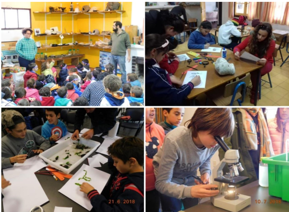
Figura 4. Talleres en torno al Rincón de Educación Ambiental.