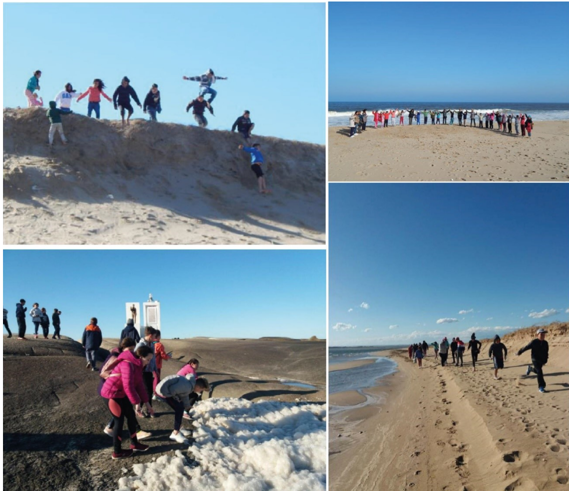
Figura 3. Caminatas por la laguna de Rocha y el Cabo Sta. María.