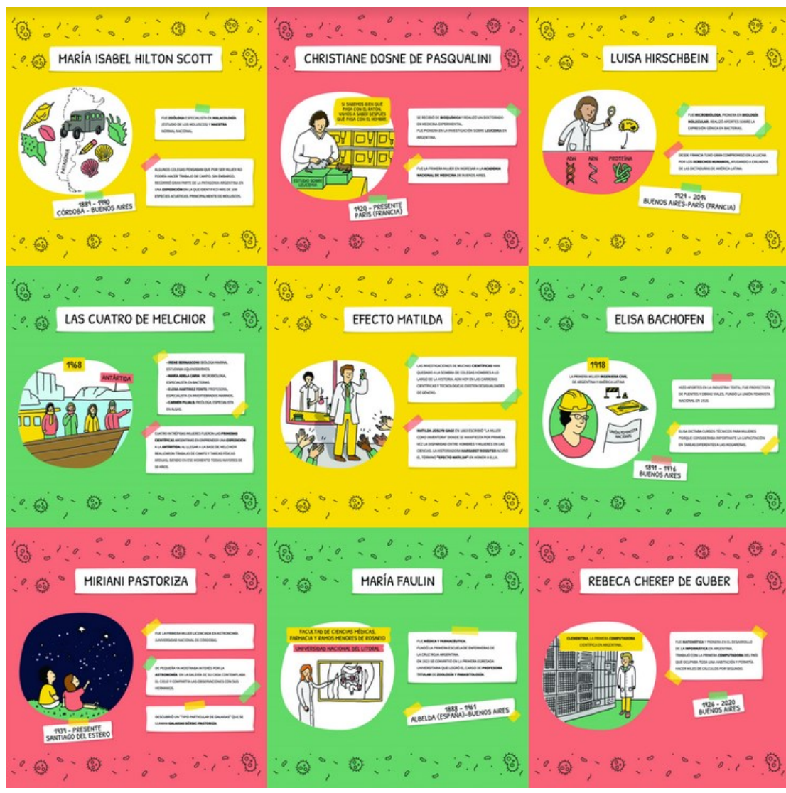
Figura 2 | Muestra gráfica «Pioneras de la Ciencia Argentina».