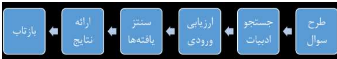
نمودار ۲: مراحل انجام فراترکیب

(Erwin, et al., 2011, p. 191). در مدل‌های مختلف که برای فراترکیب کیفی ارائه شده است در عین مشابهت‌های زیاد و یکسان بودن کلیت فرایند، تفاوت‌هایی نیز قابل ملاحظه است. از جمله این تفاوت‌ها، تعداد مراحل ذکر شده برای انجام این روش است. فرایند ارائه شده توسط اروین و همکاران از تعداد کمتری از مراحل برخوردار است و در عین حال تمامی اقدامات لازم برای فراترکیب را شامل می‌شود. اروین و همکاران فرایند فراترکیب را در شش گام معرفی می‌کنند: