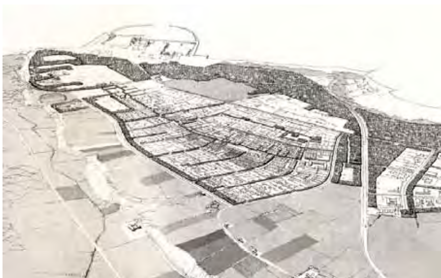
| Hanstholm. Rationalistisk byplanlægning fra 1966.