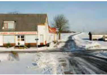
| Vester Vandet. Småerhverv ved en korsvej.

Landskabeligt kan Ny Thisted Kommune opdeles i tre meget forskellige landskabstyper. Hele den østlige del fra nord til syd omfatter det store og frugtbare moræneland. Vest og nord herfor, adskilt af et næsten sammenhængende grønt bånd af plantager, strækker klitheden sig fra Bulbjerg i nord over Hanstholm til Agger i syd. Endelig udgør Vejlerne mod nordøst et helt særegent område, afvekslende mellem våde eng-