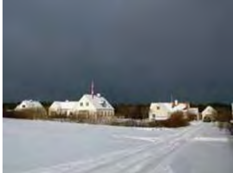
| Hanstholm. Fornyelsen af byen tager også udgangspunkt i kulturmiljøet.