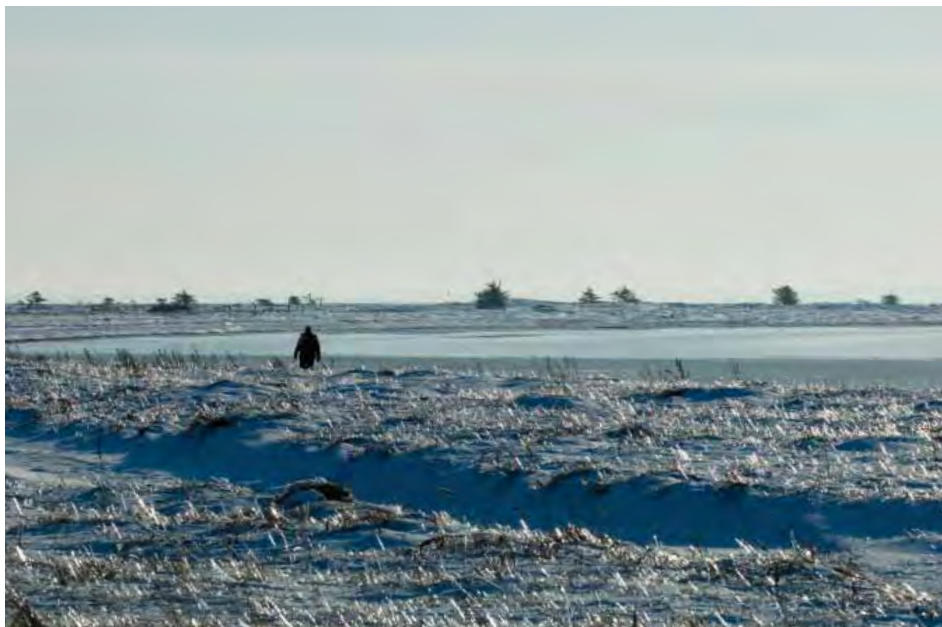
| Amtoft Vig. Landskab ved Limfjorden med store naturmæssige og rekreative værdier.