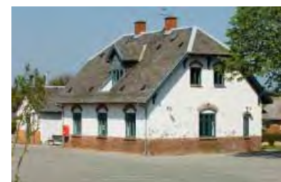
| Nors. Stationen er nedlagt, og bygningerne afventer ny anvendelse.

rende betydende stationsbyer som Hurup, Bedsted, Snedsted og Sjørring alle profiterer af tilknytningen til banen. Jernbanen og et tilpas opland omkring de gamle stationsbyer har sikkert også været medvirkende til fremkomsten af de store industrivirksomheder i Hurup, Sjørring og Nors.