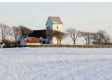
| Ydby Kirke, opført i tidlig middelalder. Et velbevaret kulturhistorisk miljø med kirke, stengærde og beplantning.

mange indflydelser udefra, var formentlig også rammen om et bispedømme, indtil udsejlingen fra fjorden sandede til i anden halvdel af 1100-årene. Da en stormflod gennembrød Agger Tange i 1825, skabtes igen baggrund for en rig og ekspansiv periode - nu baseret på sejlskibstrafik og med udgangspunkt fra købstaden Thisted.