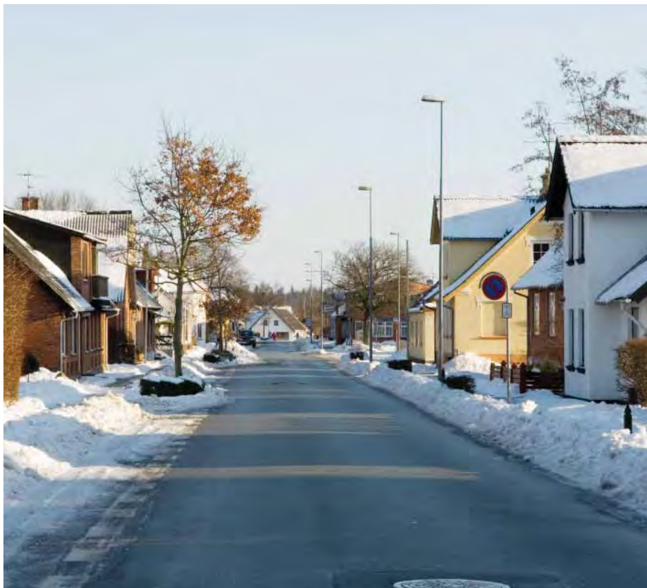
| Østerild. Den tidligere stationsby er i dag overvejende en boligby.