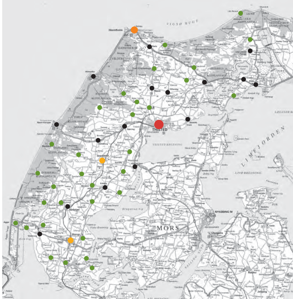
| Bystrukturen i Thy ifølge regionplanen for Viborg Amt og oplægget til Nordjydernes regionale Udviklingsplan, 2005