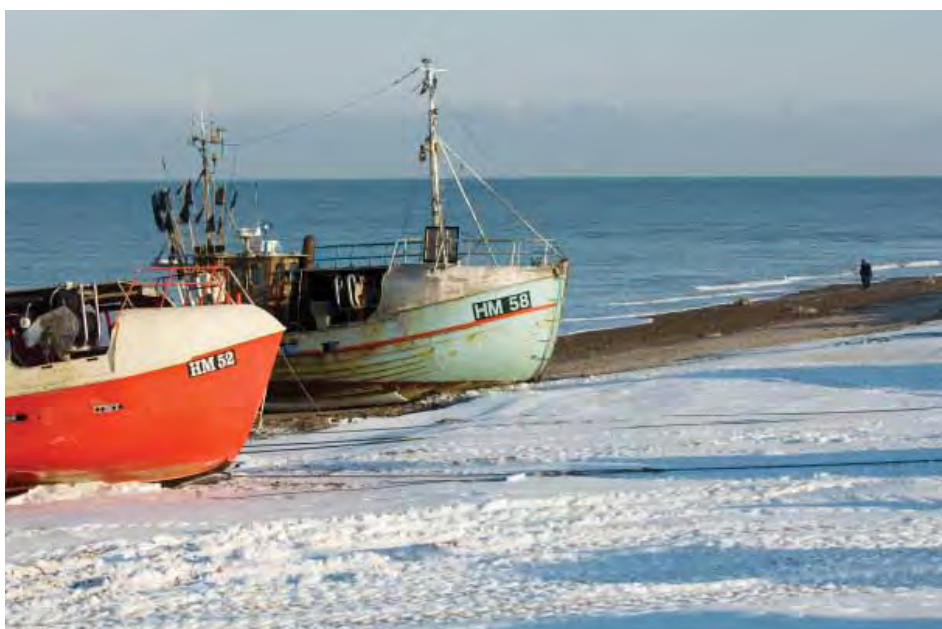
| Lild Strand. Fiskeri har til alle tider været et eksistensvilkår for mennesker i Thy.

arealer og inddæmmende fjordarme. Klitheden og plantagerne mod vest er et af de syv områder, som miljøministeren har peget på som mulig fremtidig nationalpark.