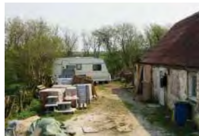
| Ydby. Dårligt beliggende landejendomme rammes først, hvis udviklingen går i stå.

Ikke alle landsbyer er lige udsatte. Som et generelt træk har landsbyer, der ligger indenfor de større byers pendlingsoplande, mulighed for en ny funktionsberettigelse som bosætnings- og oplandsby for den store by med dens arbejds-