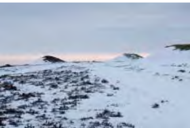
| Bronzealderhøje ved Ydby hede. Nogle af de tidligste kulturhistoriske spor i landskabet i Thy.