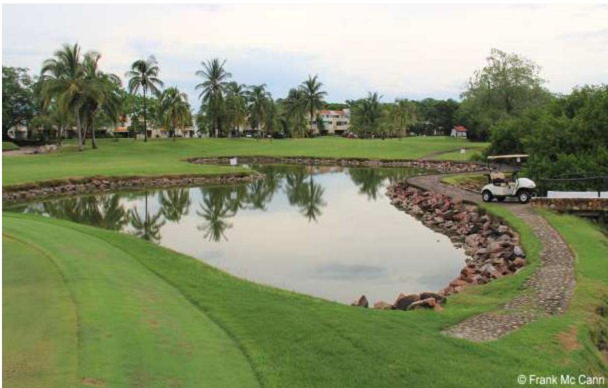
Figura 3. Vista oeste-este del campo de golf Marina Vallarta. En primer plano se observa un obstáculo de agua (water hazard) y, en segundo plano, la calle (fairway).

Asimismo, la documentación fotográfica de las aves alimentándose en los obstáculos de agua (o en sus inmediaciones) en el campo de golf (Fig. 3), pone de manifiesto la importancia de este tipo de espacio urbano como sitio de forrajeo; el cual, además, puede proporcionar beneficios significativos para la conservación de las aves acuáticas a nivel regional (Tanner & Gange 2005, White & Main 2005).