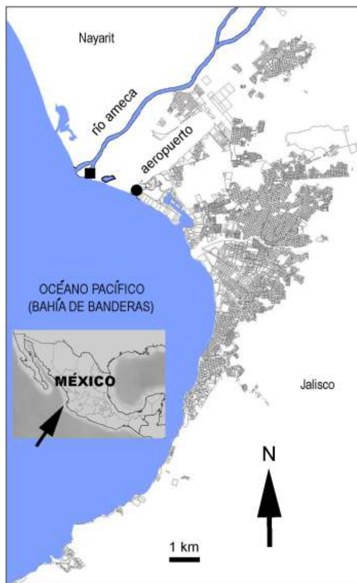
Figura 1. Localización de las zonas de observación (cuadro negro = Boca de Tomates, círculo negro = campo de golf Marina Vallarta) en la zona urbana de Puerto Vallarta, Jalisco, México.

alimento de la garza blanca, Ardea alba Linnaeus, 1758 (Figs. 2A-2B). De la misma forma, se registró a la tilapia del Nilo, Oreochromis niloticus (Linnaeus, 1758), en la dieta de A. alba (Fig. 2C), M. americana (Fig. 2D) y Phalacrocorax brasilianus (Gmelin, 1789) o cormorán oliváceo (Fig. 2E); al pez chochoco, Dormitator latifrons (Richardson, 1844), consumido por la anhinga o Anhinga anhinga (Linnaeus, 1766) (Fig. 2F), la garcita