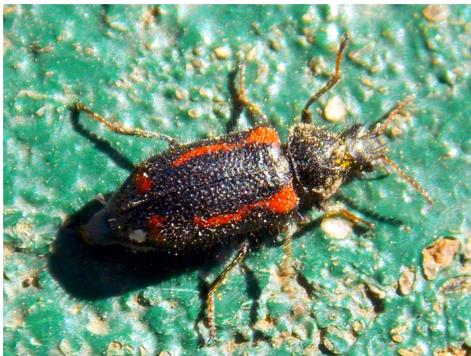
Figura 2. Ejemplar hembra de Astylus lojaensis (Foto Gino Juárez).