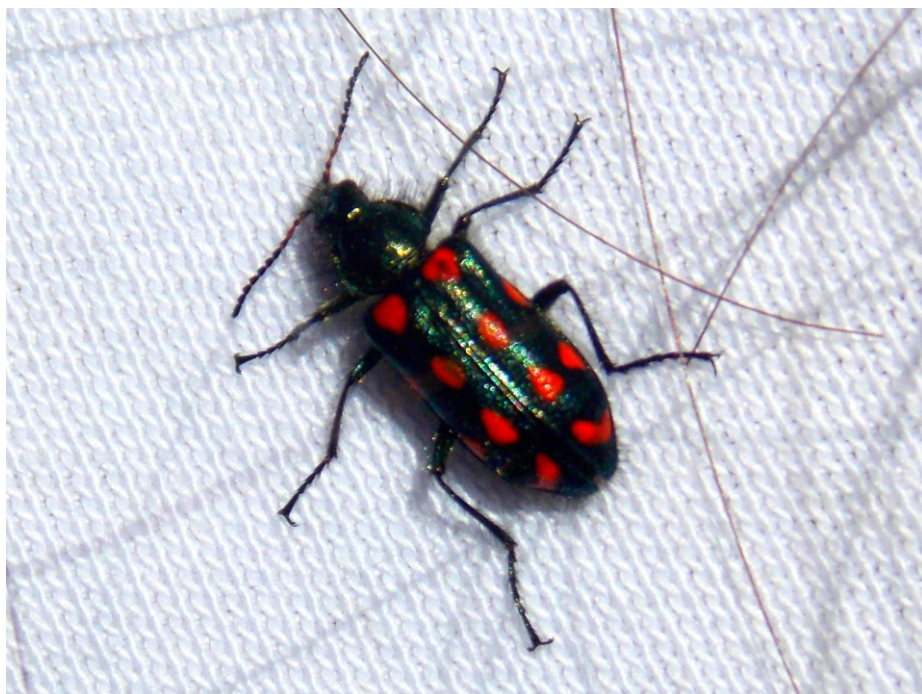
Figura 3. Ejemplar macho de Astylus longulus.