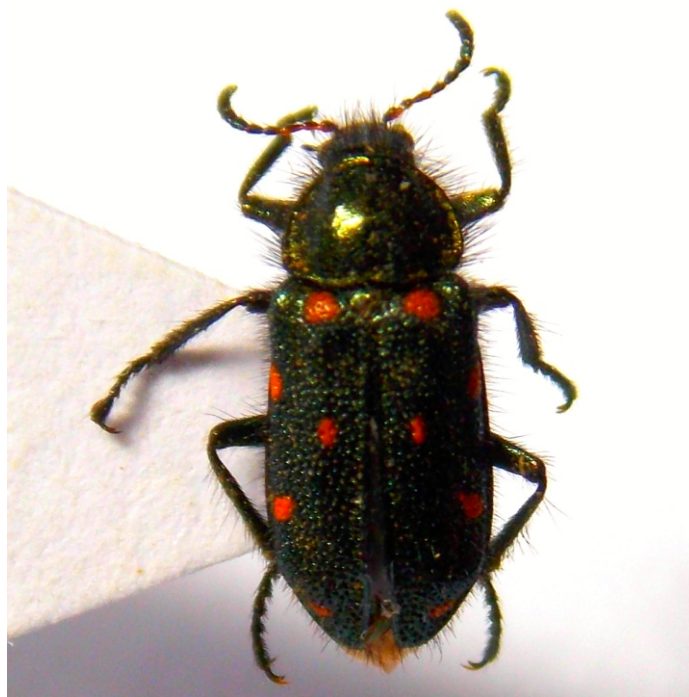
Figura 4. Ejemplar hembra de Astylus longulus.