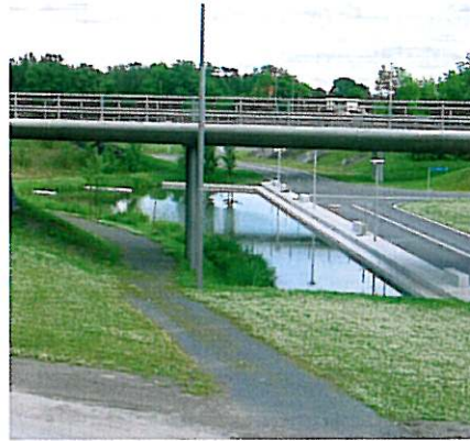
Figur 1. Et vådt regnvandsbassin indpasset i et vejanlæg.

På grund af de store vandføringer der forekommer, er et tredje og ikke uvæsentligt hensyn ved valg af teknologi til rensning af separat regnvand, at anlæggene skal placeres decentralt, og at der derfor skal etableres mange anlæg. Det enkelte anlæg skal følgelig være robust og driften skal være simpel og billig.