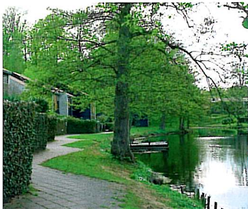
Figur 3. Et vådt regnvandsbassin indpasset i et boligområde.

I Figur 1 og Figur 3 ses eksempler på, hvordan våde regnvandsbassiner kan indpasses i forskellige typer af by.