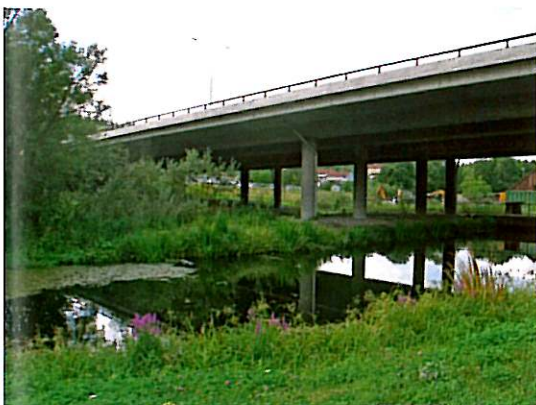
Figur 4. Det våde regnvandsbassin i Skullerud krydset, Oslo, Norge.