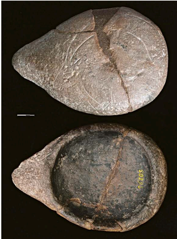
Tête de bouquetin gravée sur une lampe en grès rouge (MAN 50 295) découverte dans le niveau magdalénien.