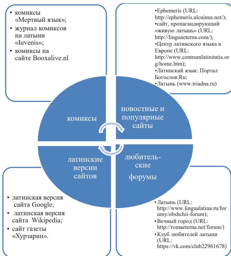
Рис. 2. Информационные ресурсы в сети интернет для самостоятельного изучения латинского языка [7]

материалы. Представим краткий обзор сведений о цифровых библиотеках и порталах с самой большой базой источников латинских и греческих материалов: