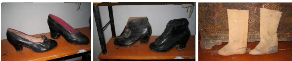
Рис. 5. Музейные экспонаты-подлинники обуви (ст. Надежная, Краснодарский край): а) кожаные туфли и резиновые галоши, б) резиновые боты, в) – валенки

пара простых портянок в ценах конца XIX – начала XX в. стоила 60 к., пара шерстяных – 2 р. [6, с. 157]. Помимо сапог, поршней, чужак и чевяк, казаки линейных станиц, по сведениям литературных источников, носили бахилы, ботфорты и валенки. Бахилы представляли собой мягкие кожаные сапоги с длинными голенищами, которые закреплялись на ноге ремешком, продернутым через петельку, пришитую к заднику; завязывался ремешок под коленкой. Ботфорты покупали на ярмарках и в лавках [13, с. 322]; представляли они собой сапоги с высокими голенищами, которые закрывали колени и даже части бедра наездника.