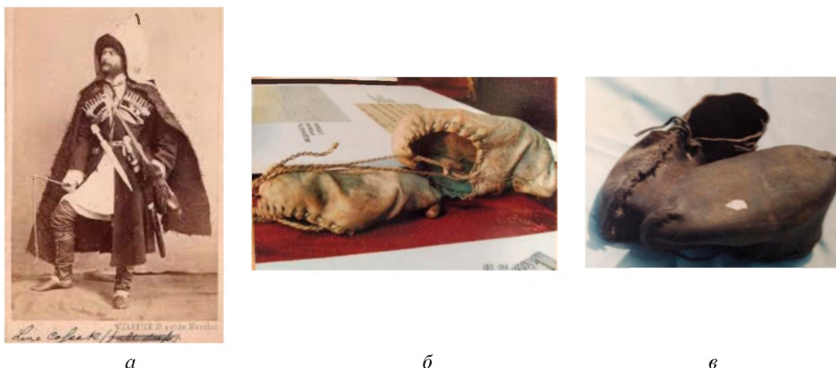
Рис. 2. а) на исторической фотографии изображена обувь: чевяки, ноговицы, наколенники; музейные экспонаты-подлинники обуви: б) чевяки (г. Абинск), в) поршни со швом на носке и заднике (ст. Надежная Краснодарского края)

[4, с. 164]. Чевяки иной раз представляли собой цельное изделие, состоящее из трех частей: чулка, ноговицы и самого чевяка. Ноговицы изготавливались из домотканого сукна, войлока или из кожи в виде гамаш, надеваемых поверх штанов; они защищали ноги от пота лошади во время верховой езды. Шили ноговицы с одним швом сзади или соединяли между собой два куска материала спереди и сзади вертикальными швами. Закреплялись ноговицы под ступней штрипками [5, с. 96–97]. Чувяки с ноговицами, входящие в комплект обмундирования конно-казахских полков ККВ, стоили 3 р. 25 к. [6, с. 157]. В начале XX в. ноговицы стали соединять с чевяками, получая обувь типа мягких сапог. Есть сведения, что в линейных станицах ноговицы называли по-голенками [2, с. 198]. Чевяки изготавливали из козловой легко растягивающейся кожи, кроме чулка, который изготавливали из бараньей кожи.