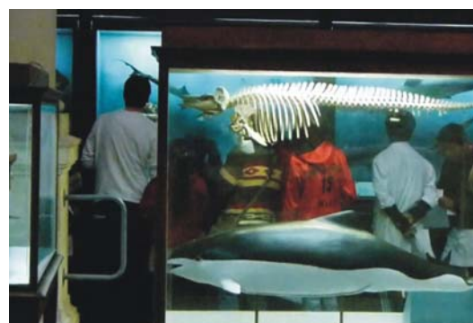
Figura 4. Visita al Museo de La Plata y sus laboratorios.

5. Taller vivencial de prácticas de campo en paleontología: se recrea el hallazgo de fósiles en el ámbito escolar, utilizando herramientas y materiales propios de la disciplina