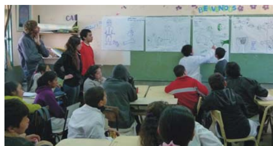
Figura 1. Izquierda: construcción de un molde y réplica. Derecha: taller sobre el ámbito laboral del paleontólogo.

2. La sucesión biológica a través del tiempo geológico: En este bloque se abordan temas como tiempo absoluto y relativo (Fig. 2), la evolución de la vida en la tierra y su vínculo con la deriva continental (Fig. 2).