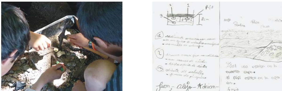
Figura 5. Izquierda: búsqueda de “fósiles” en distintos niveles de terreno. Derecha: libreta de campo y construcción de un perfil geológico con sus fósiles.

(piquetas, brújula, libreta de campo, yeso, vendas, pinceles, etc). Se buscan restos “fósiles” en diferentes niveles de suelo, se utilizan los principios de la tafonomía para establecer tiempo y factores que actuaron durante su enterramiento.