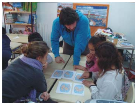
Figura 2. Izquierda: elaboración de afiches sobre tiempo absoluto y relativo. Derecha: reconstrucción de la deriva continental.