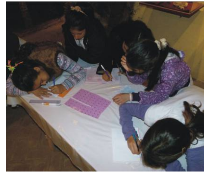
Figura 7. Taller Itinerante en el Museo Paleontológico Municipal de San Pedro "Fray Manuel de Torres", San Pedro.

Además de las actividades realizadas en las diferentes instituciones mencionadas, el equipo de trabajo del proyecto realiza reuniones quincenales para planificación y diseño de actividades, evaluación del desarrollo del proyecto y capacitación de los nuevos talleristas.