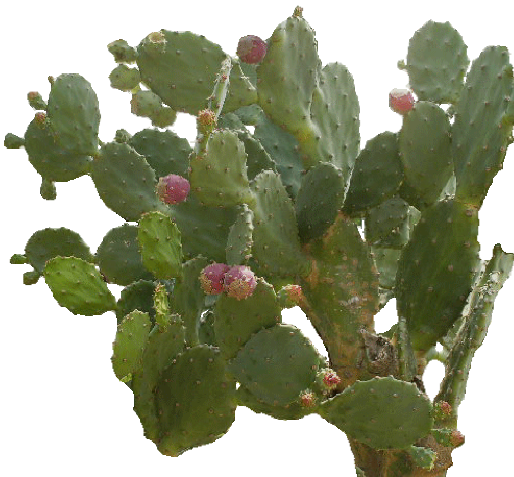
Figura 1.- Cladodios y frutos de la especie Opuntia boldingii Britton y Rose.

los más estables) y filocactina declinó 39 %. En contraposición, para isofilocactina se observó una cantidad de 58 % de la proporción del área del pico en la dosis de concentración más alta de enzimas (2 % p/v). En la muestra tratada con la dosis de concentración más baja de enzimas, isohilocerenina no fue detectado pero a mayores dosis aumentó gradualmente a 7 %. En todas las muestras tratadas enzimáticamente, filocactina fue el menos estable y su degradación fue más rápida en comparación a los otros pigmentos y tomando en cuenta que las condiciones de pH, temperatura y tiempo se mantuvieron constantes en todo el estudio, la variación en la concentración de pigmentos fue