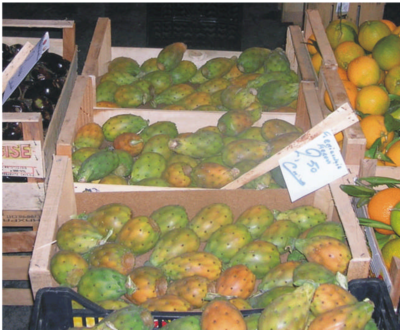
Figura 2.- Frutos de Opuntia ficus-indica para la venta a granel en un mercado de Palermo, Sicilia, Italia.

hedónica de 10 puntos para los atributos color, sabor y consistencia, se mantuvo. Otro fruto estudiado por los mismos autores con potencial alimentario en la región es el del cactus columnar cardón lefaria ( Cereus repandus ) (Emaldi et al. , 2004) y cabe agregar que los frutos del cardón de dato ( Lemaireocereus griseus (Haw.) Britton y Rose), son una fuente de alimento para los pobladores locales y representa una alternativa de consumo fresco e industrial, presentando colores de pulpa, roja,