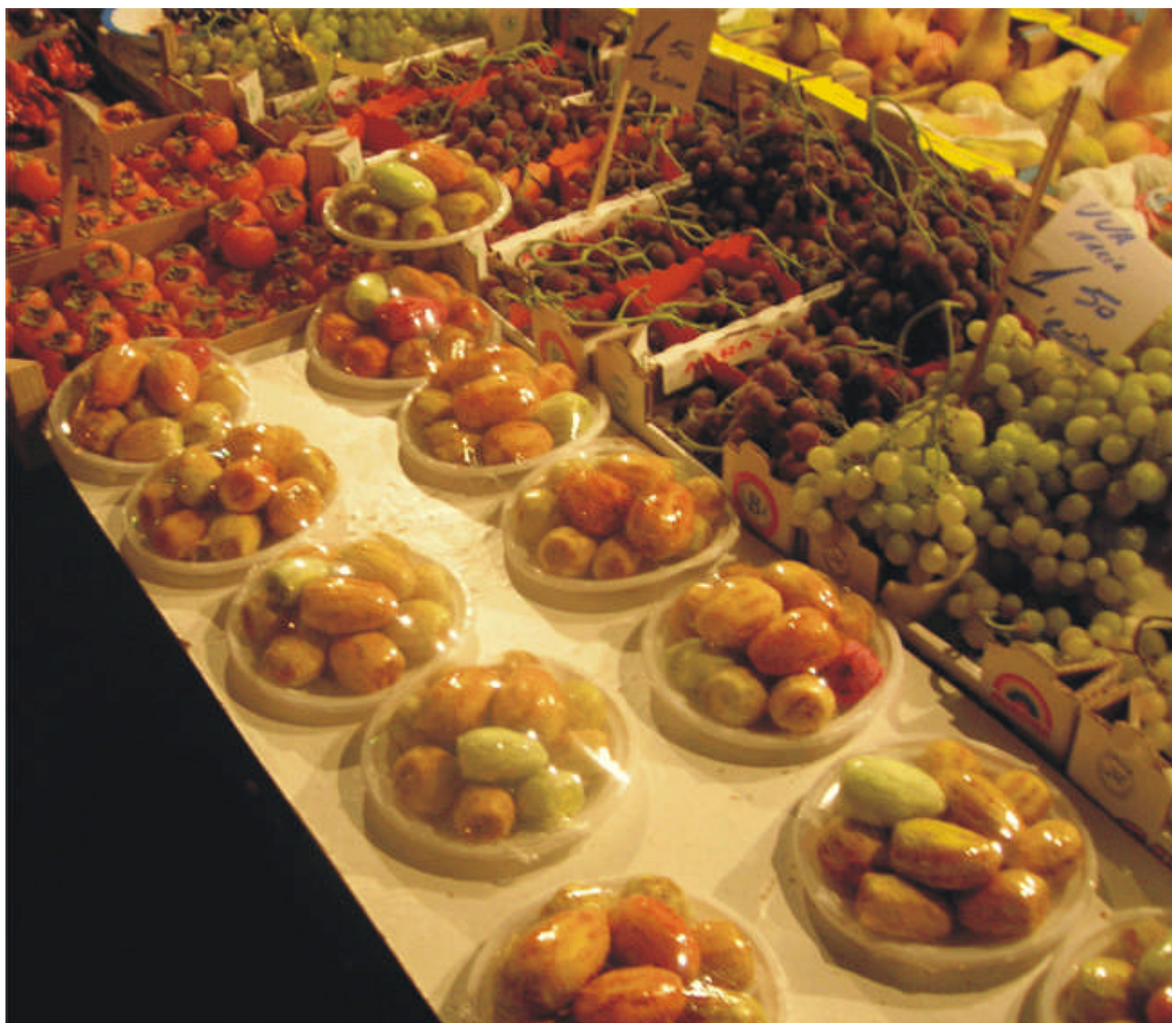
Figura 3.- Frutos de Opuntia ficus-indica mínimamente procesados dispuestos para la venta en un mercado de Palermo, Sicilia, Italia.

El-Samahy et al. (2009) estudiaron la posibilidad de producir helado tipo ‘ice cream’ usando concentrados de pulpa de frutos de cactus ( Opuntia ficus-indica ) a concentraciones de 5, 10 y 15 % en la mezcla, determinando porcentajes de incremento en volumen de helado en relación a la cantidad de mezcla inicial utilizada (‘overrun’) de 46,67; 43,78 y 43,11 %, respectivamente, es decir una